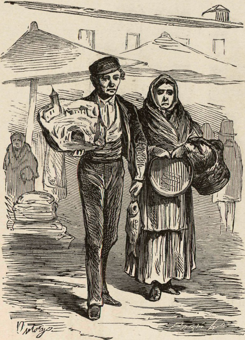
LOS DEL PUEBLO.

Quando al pueblo no le falta—colacion y nacimiento ¿ dónde habrá más alegría—que en el pobre hogar del pueblo?