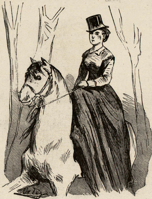
Una amazona de la corte.