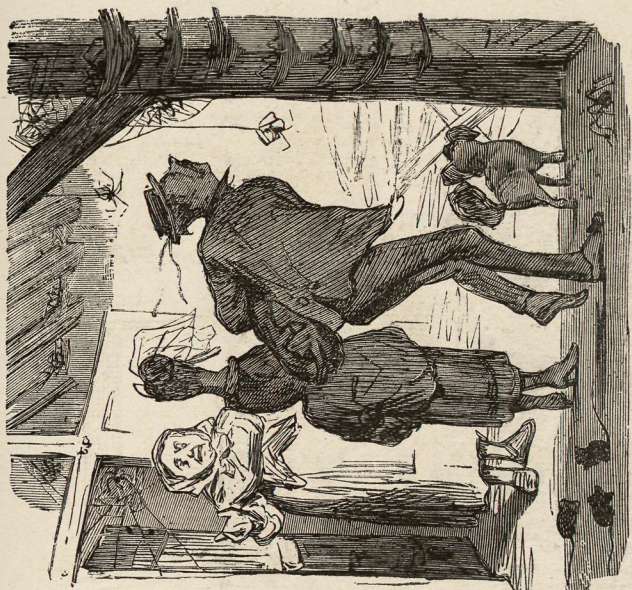
Instalacion en la fonda.