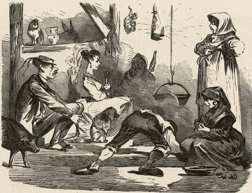
Estrado de la fonda.