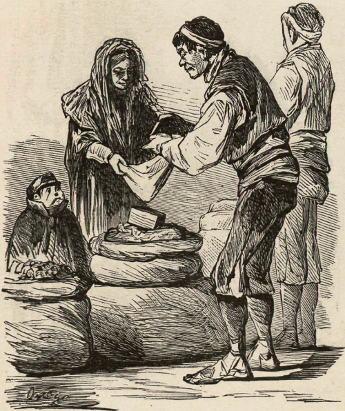
LA QUE COMPRA CASCAJO.

Que me lo peses corrido—y del mejor de Alicante, porque no todos los dias—nos convida aquel que sabes.