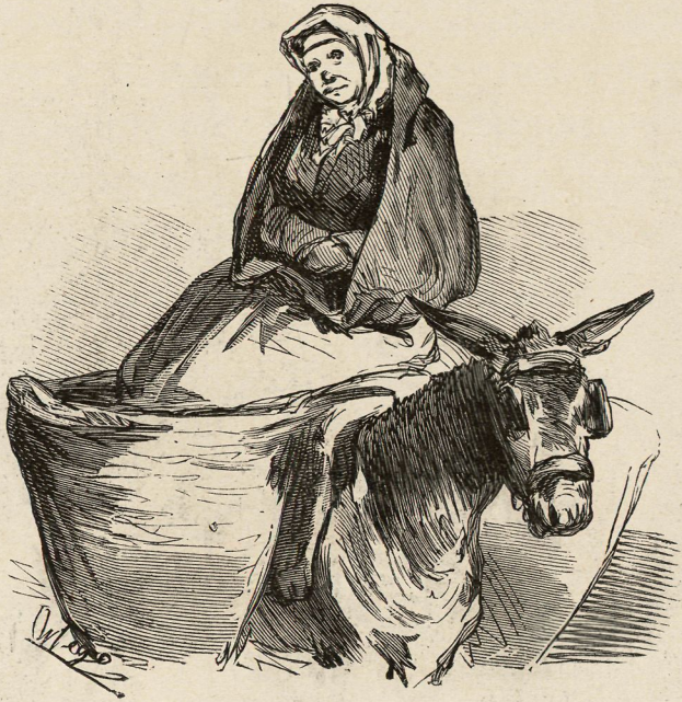
Una amazona de Fuencarral.