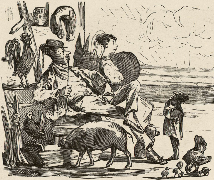
Contemplacion del ocaso.