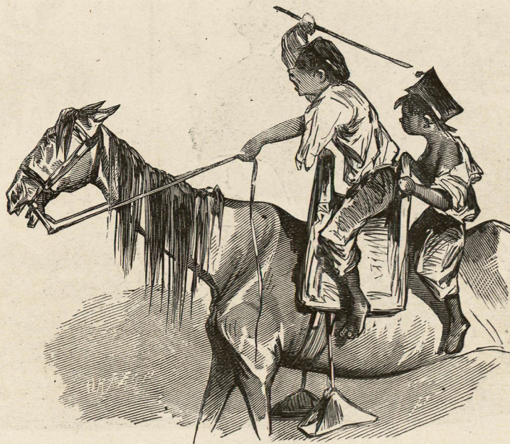
El bello ideal de los granujas.