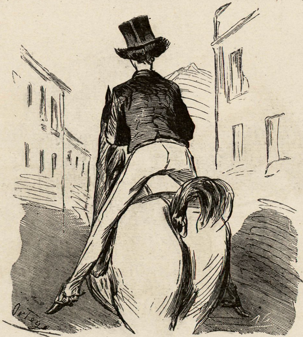
A la inglesa.