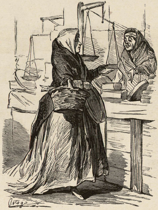
LA QUE COMPRA TURRON.

Quando al pueblo no le falta—colacion y nacimiento ¿ dónde habrá más alegría—que en el pobre hogar del pueblo?