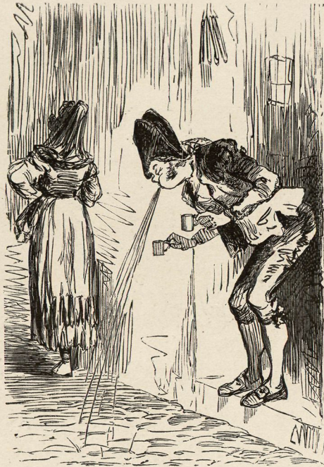
La escasez de antaño,