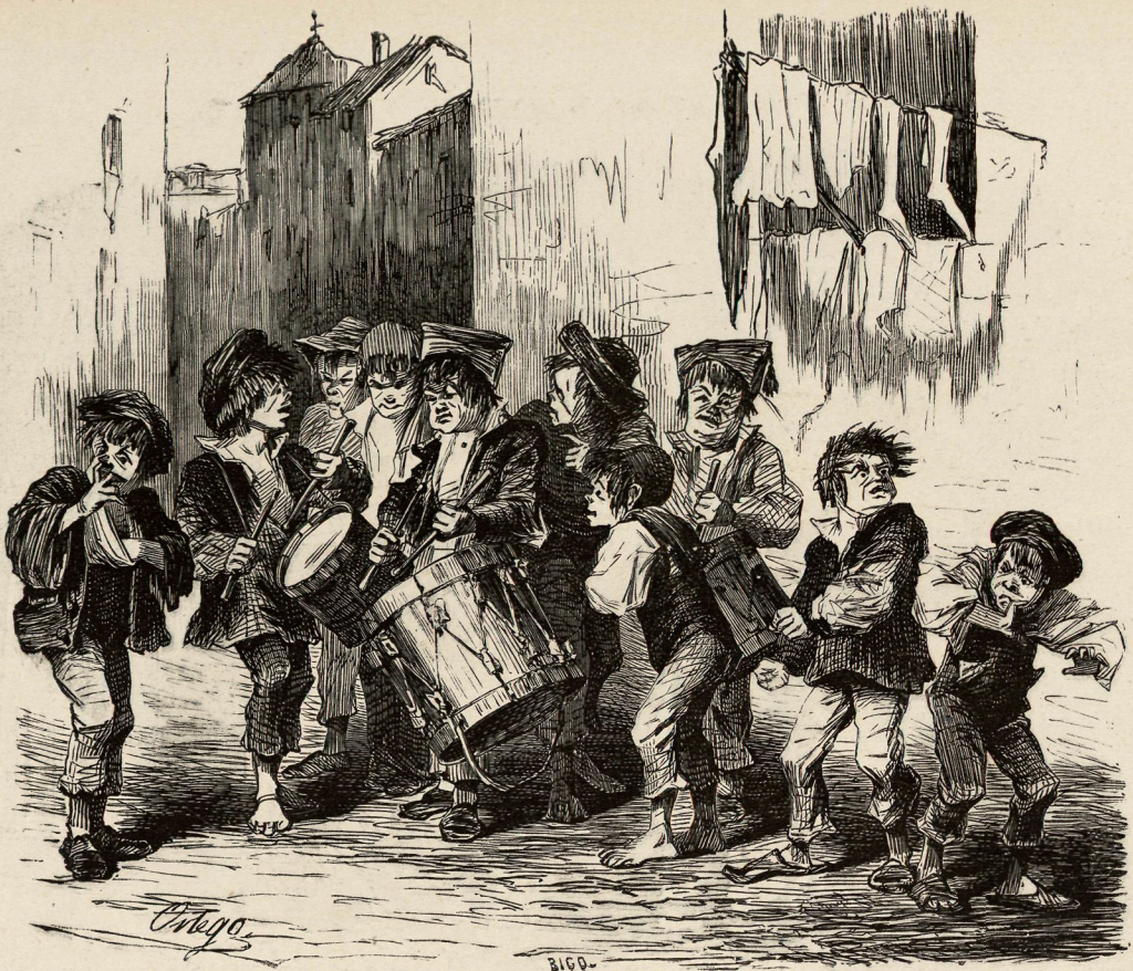
Los de Maravillas.