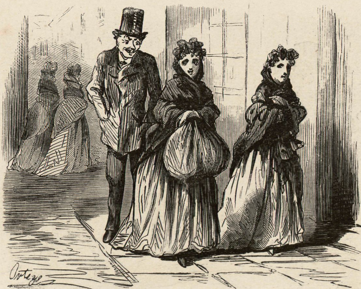
Las ocho dan y empiezan las conquistas de los aficionados á modistas.