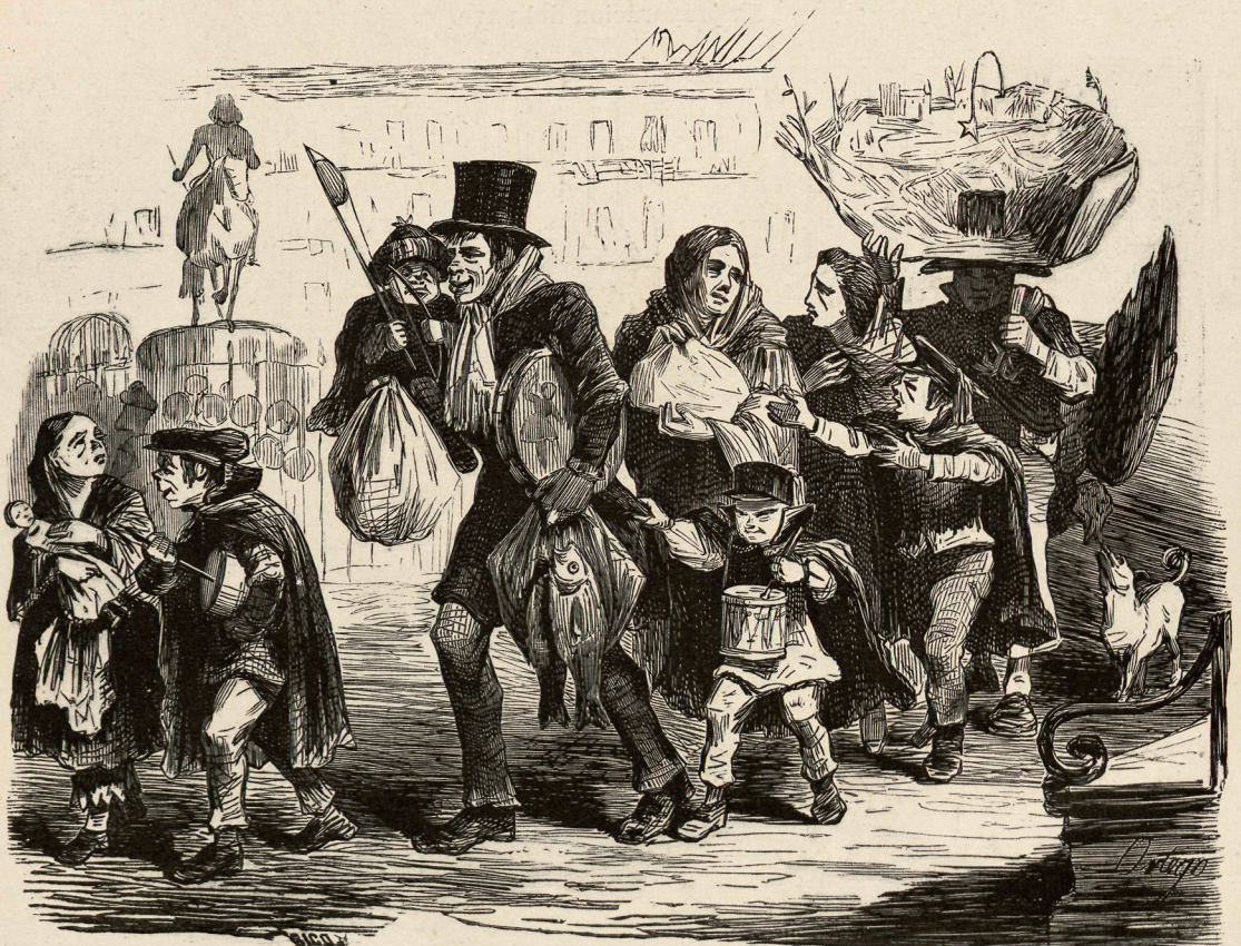
Vuelta de la Plaza Mayor.