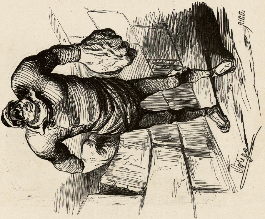
Un hombre de puños.