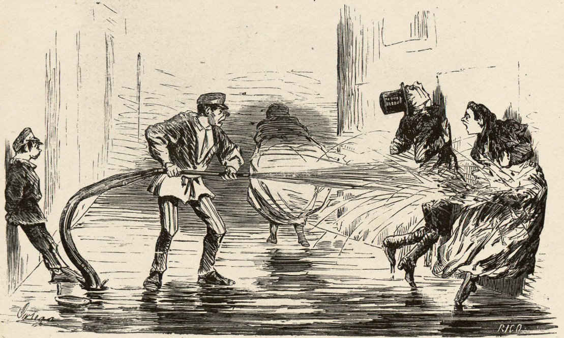
La abundancia de ogaño.