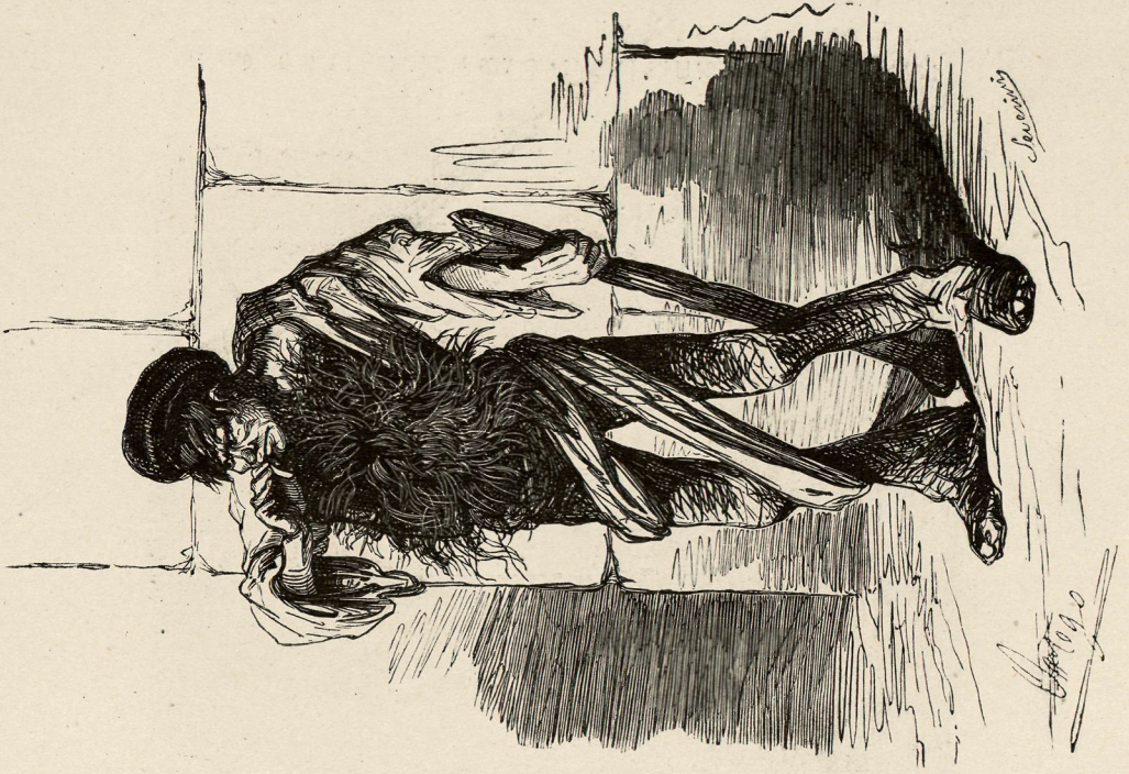
Un hombre de pelo en pecho.