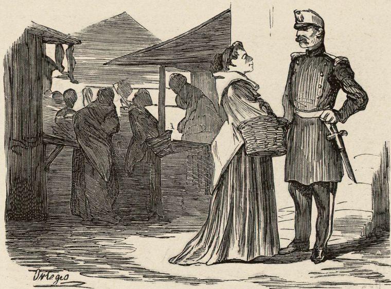
A las siete se animan las plazuelas y pone allí el amor sus centinelas.