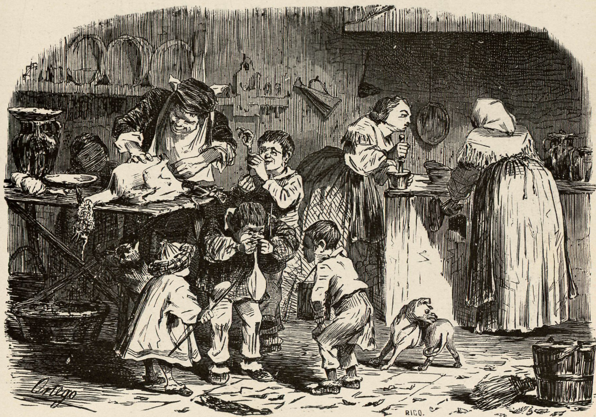
La preparacion del pavo.