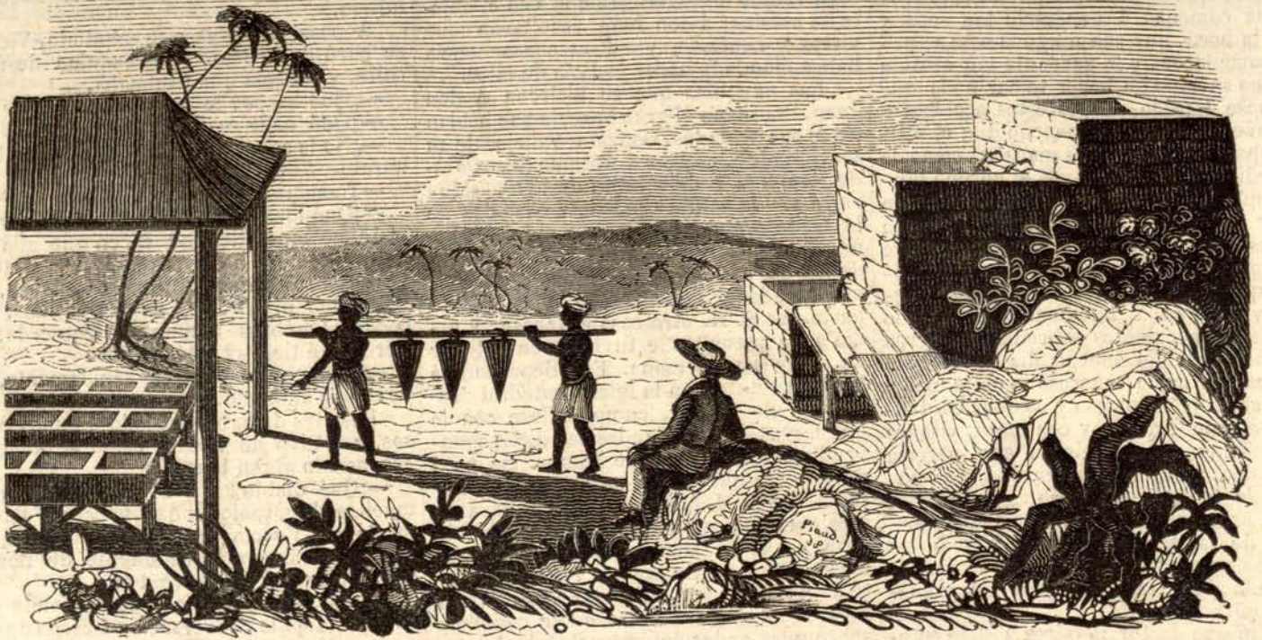
Fábrica de añil en la India.