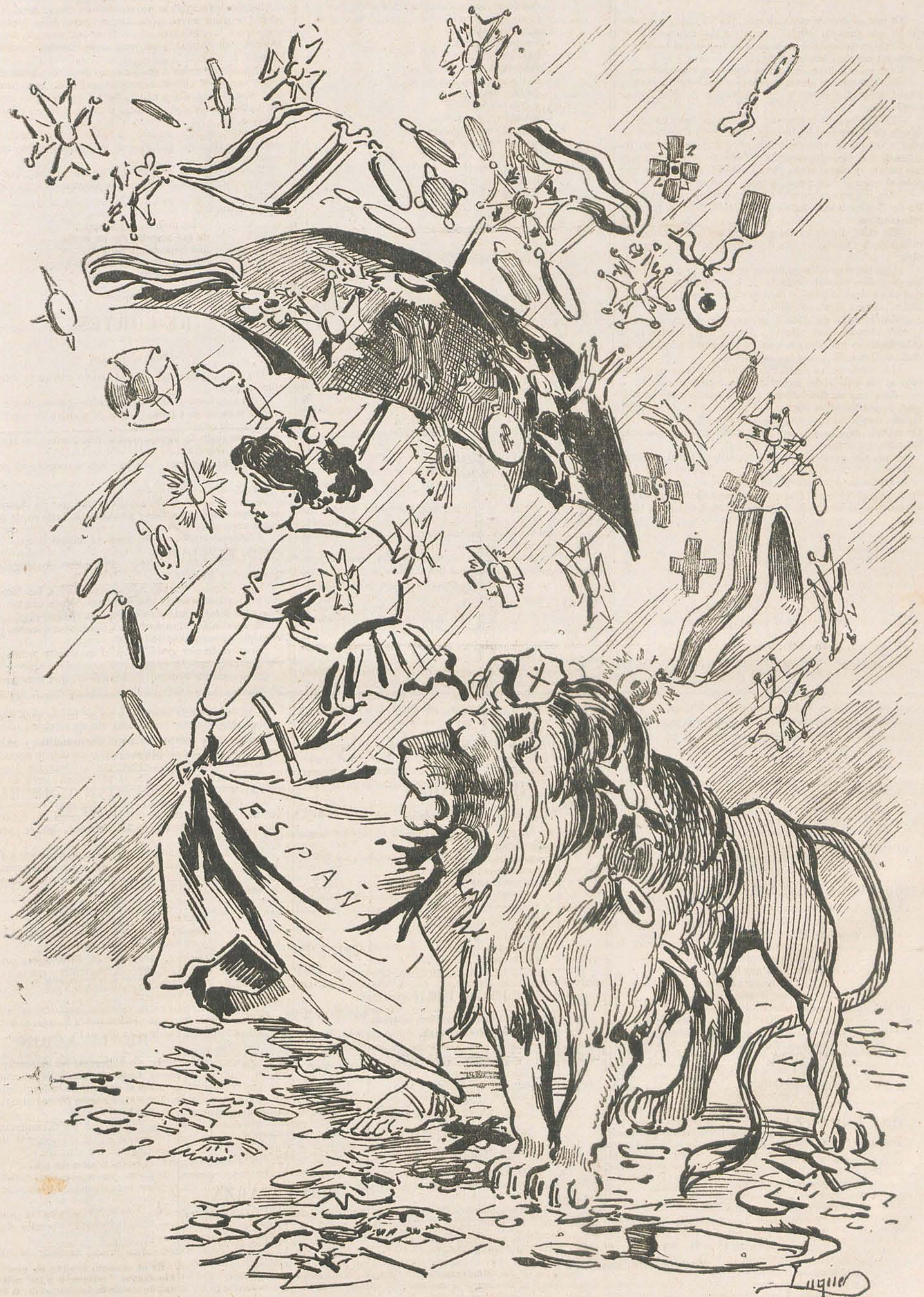
Cánovas lluvioso—y Elduayen rumboso—sacan á Mayo—florido y hermoso!