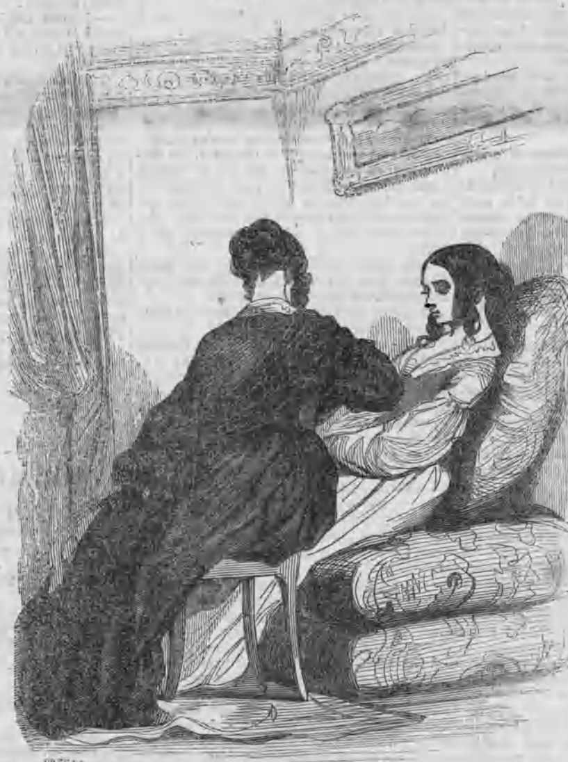
Muy abatida y aplazada me encuentro hoy.

Emilio habia vivido el no último en el castillo de Plenoel, gozando de la felicidad presente con cierta tristeza, conociendo que no podia