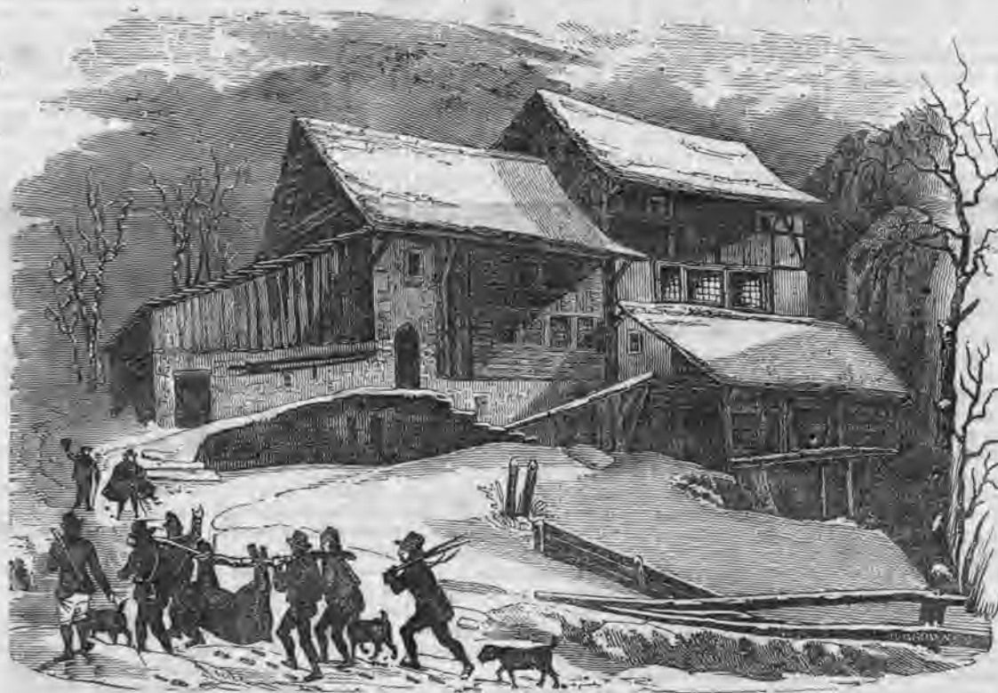
Paisage de invierno.—La caza del oso.

El elébore negro tan robusto como él, nos obsequia también con sus hermosas flores durante el invierno: si bien es verdad que estas