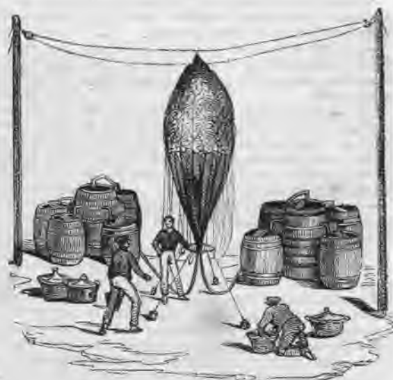
Modo de llenar un globo con gas hidrógeno.

junto á la chimenea daba indicios de que existía una segunda habitacion.