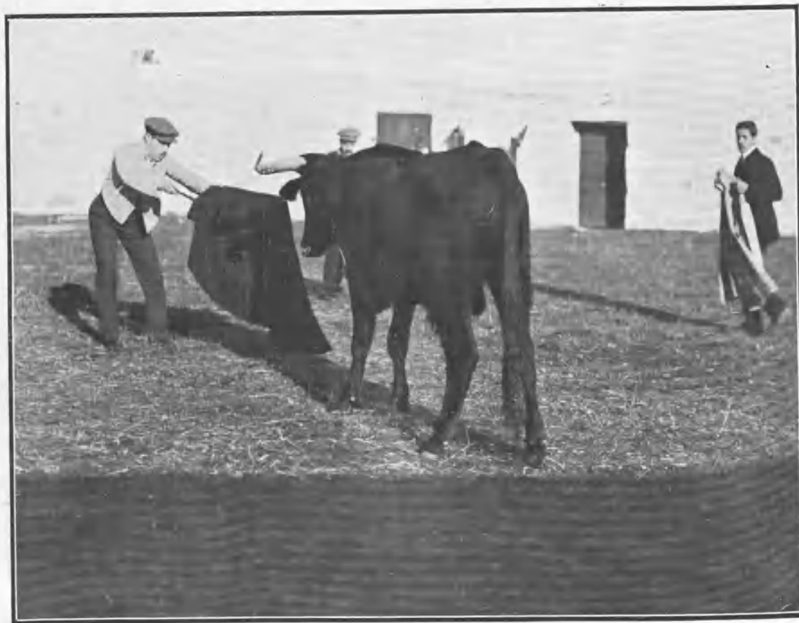
Córdón pasando de muleta.