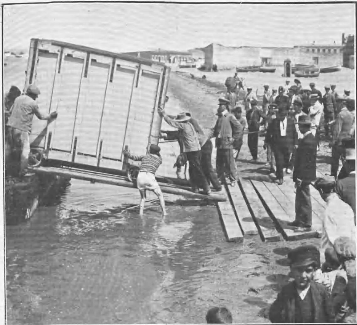
Desembarco de un cajón.

á una distancia de miles y miles de millas. Claro es que el ganado pierde con estos teje manejes y cuando se lidian no tienen el poder que conservan cuando no han perdido el hábito del campo, en el que no desechan nunca la fiereza salvaje que deben sacar á los redondeles. Realmente, es maravilloso ver cómo el hombre