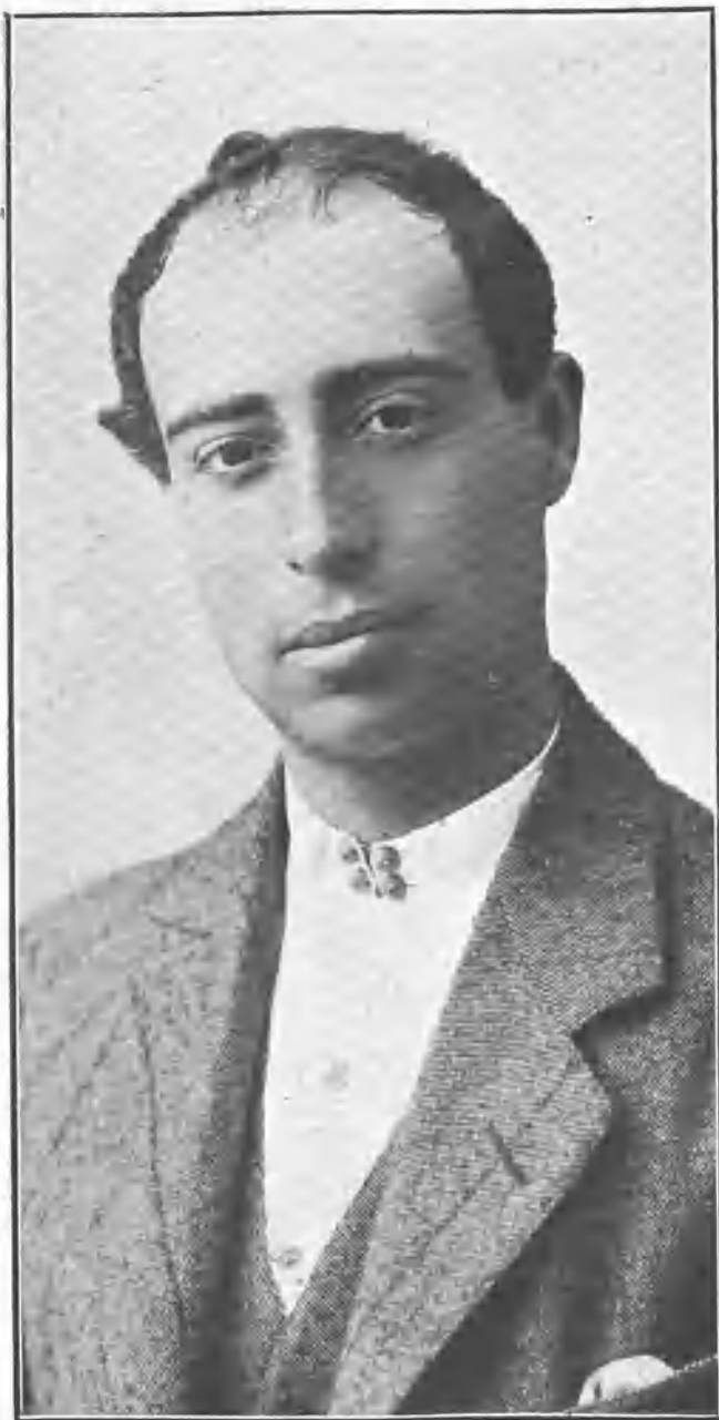
Ultimo retrato de Rafael Gómez ( Gallito ).