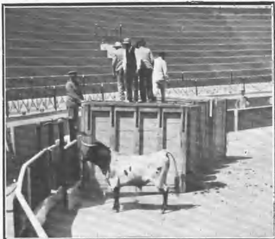
Toro en libertad.