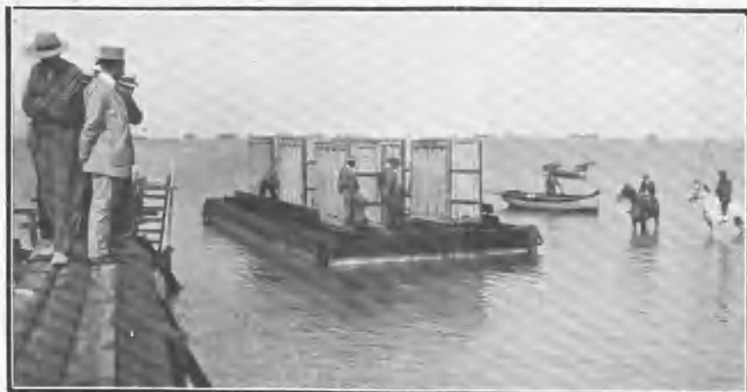
Un lanchón con cajones de toros.

compuertas dejan caer oportunamente los operarios destinados al efecto, que, con la constante práctica, son peritísimos en estas difíciles operaciones.