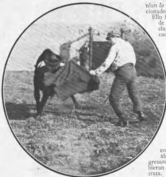
Córdón pasando de muleta.

marques ganadero. La fiesta había transcurrido con toda felicidad. Con un día que ni de encargo, con una alegría en los ánimos que se advertía en todo momento, sin incidentes deplorables como algunas veces suelen ocurrir en casos análogos, no hubo más que motivo para plácemes por parte de todos.