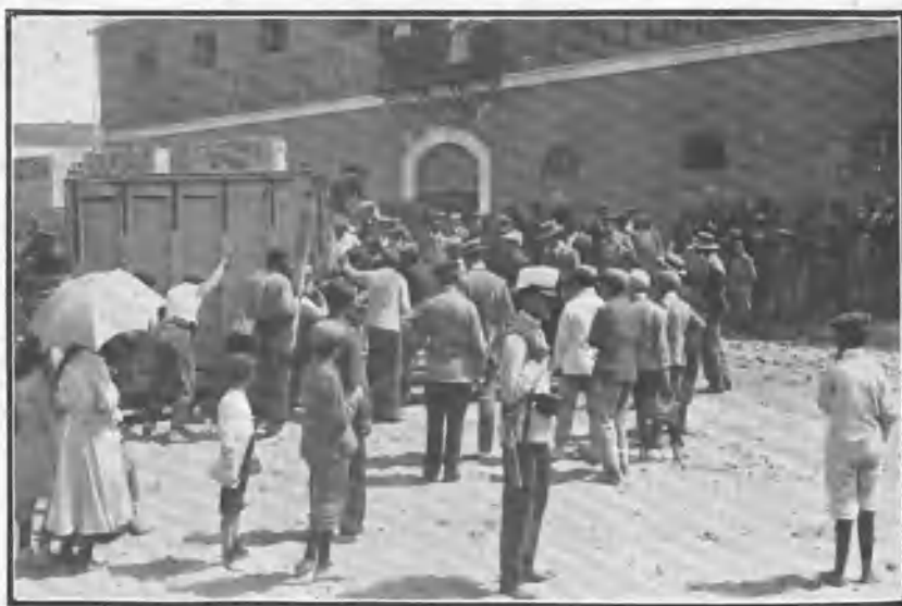
Conducción de un cajón.

Es maravilloso ver cómo se llevan los toros á los encerraderos y se les obliga, cual si fueran dóciles borregos, en aquellos estrechos pasillos de los corrales, á que penetren por la única puerta por donde encuentran salida fácil y ellos solos se cuelen en los cajones, cuyas correderas ó