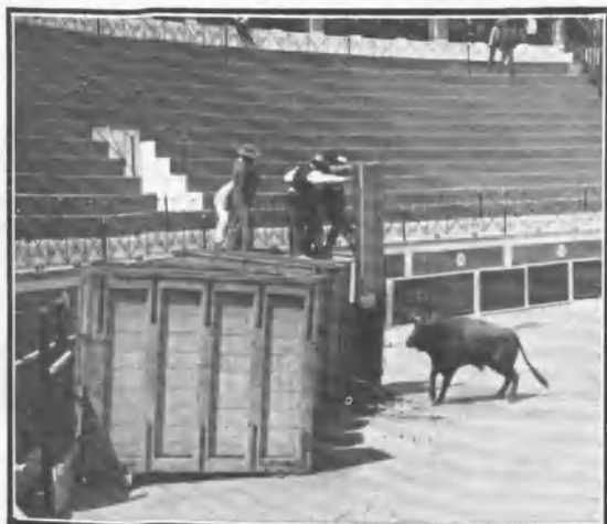
Al salir del cajón.

domina y reduce á la poderosa fiera; pero hay que confesar que los nuevos procedimientos son los que más han contribuido á que los criadores aprovechen todo y cada día haya más corridas; pero con peor resultado para la brillantez de la fiesta precisamente por las razones que dejamos apuntadas.