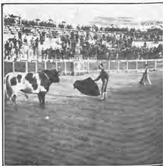
Padilla presentando la muleta al toro.