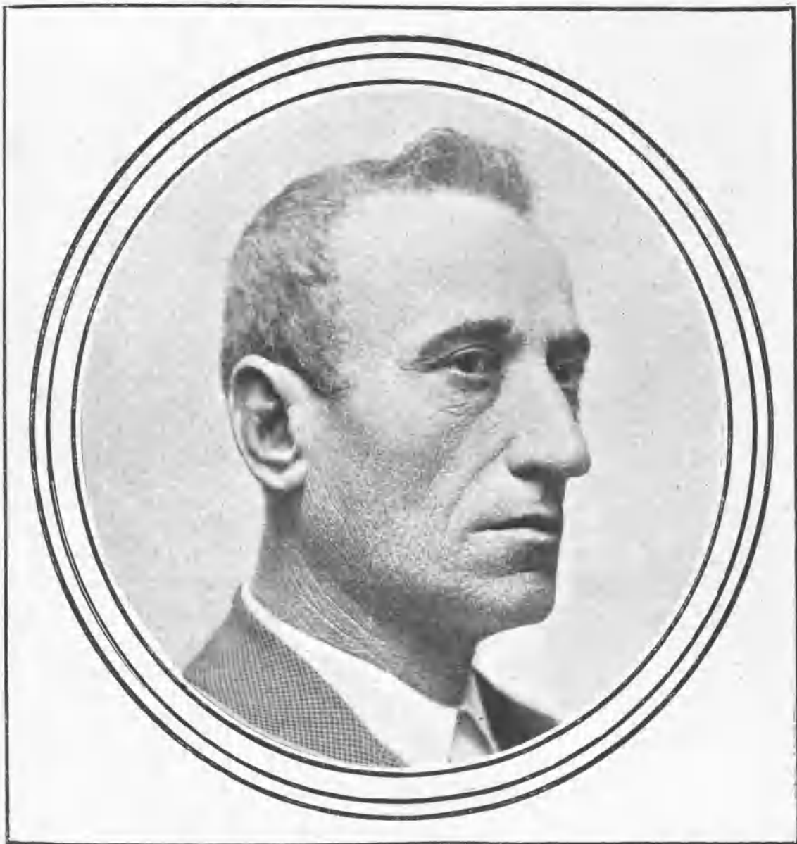
Rafael Molina (Lagartijo).

El cielo continuaba gris, y por la mañana la llovizna manchó las calles, embarrándolas. Hubo temores de suspensión. Se medio serenó la tarde,