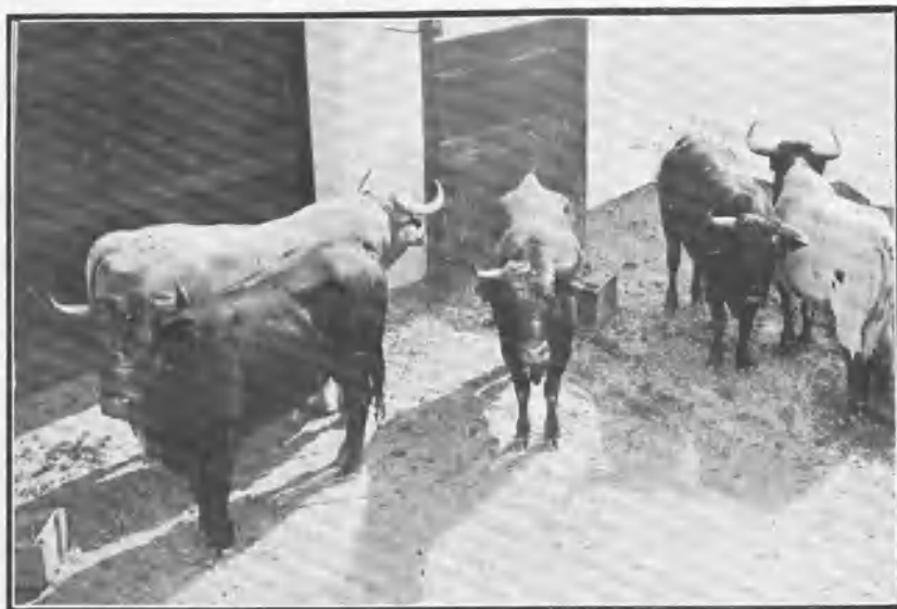
» Toros preparados para el encajonamiento.

Ya hace años que se acabaron los clásicos encierros de toros en vísperas de corridas, número importante que formaba parte muy esencial de ferias y fiestas.