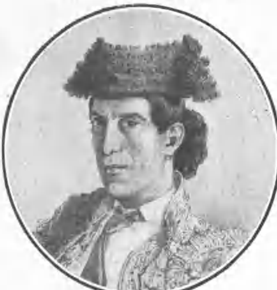
MEDIADOS DEL SIGLO XIX

No es este artículo una segunda parte del que, cuajado de fino ingenio, publicó, desde el tendido II, el saludísimo Aficiones en el número 31 de LOS TOROS.