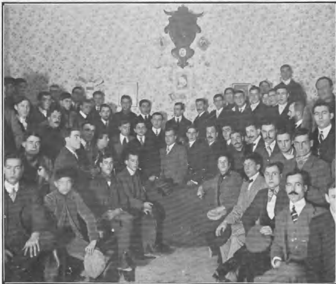
CLUB MAZZANTINI EN EL DÍA DE SU PRIMERA JUNTA EN EL NUEVO LOCAL

En los primeros días de Enero se procederá á la elección de Junta directiva, y en cuanto ésta sea nombrada, se procederá á la inauguración oficial.