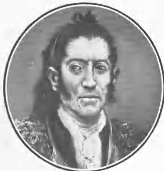
PRIMER TERCIO DEL SIGLO XIX