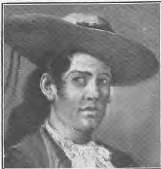
VESTIDO DEL SIGLO XVIII