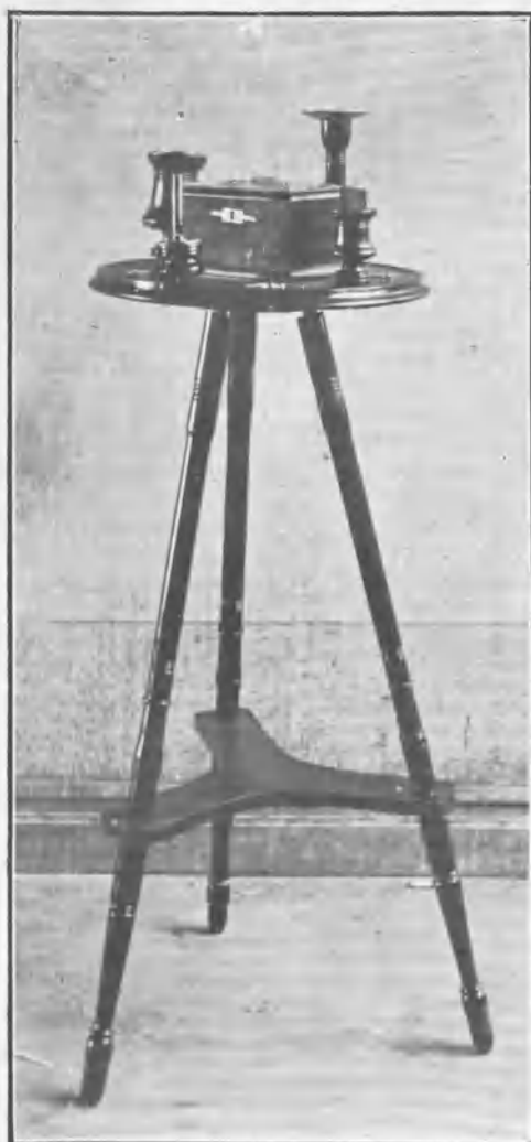
SEGUNDO PREMIO. MESA PARA FUMADOR

El segundo premio, una mesita con aplicaciones de metal dorado, para fumador, tiene la altura conveniente, y es, por sus líneas, un mueble elegante y práctico, en el cual no falta deta-