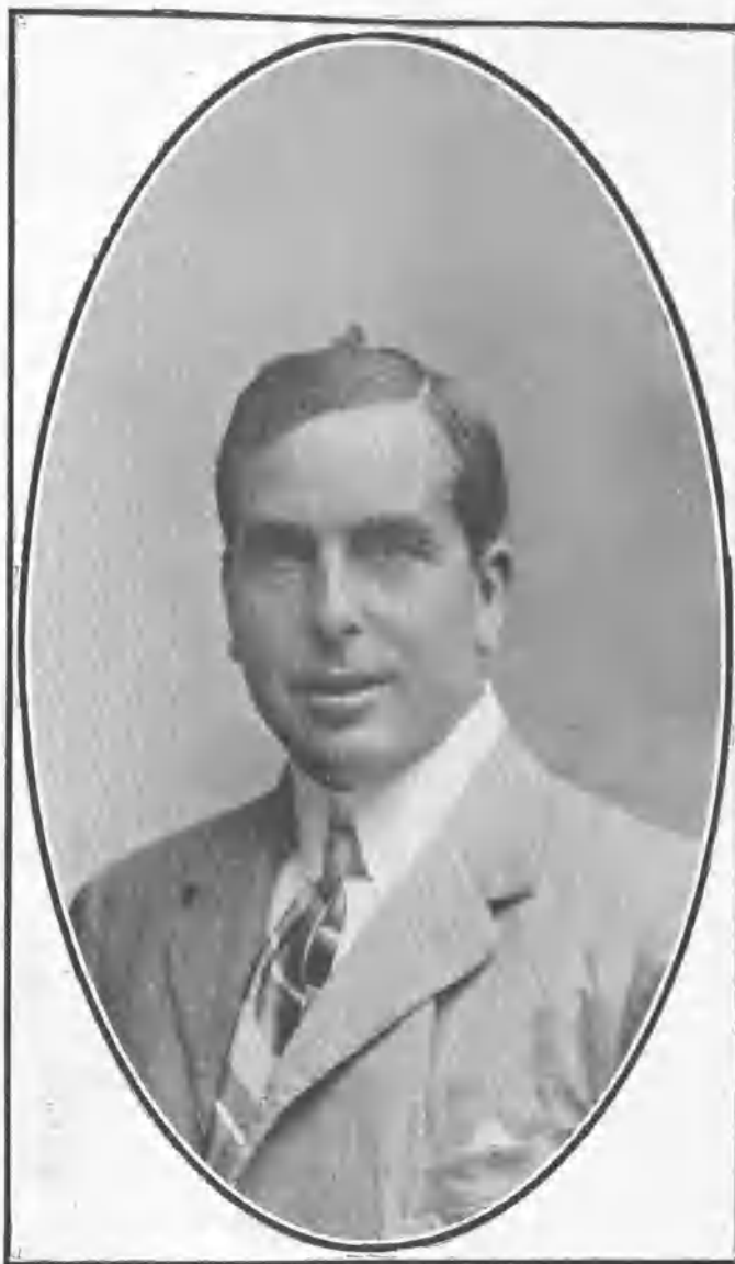
ALGABEÑO EN LA ACTUALIDAD

No fué chica su labor, y trabajo grande fué el que realizó hasta que los públicos se convencieron de que podía alternar dignamente con los buenos de su tiempo. La alternativa la