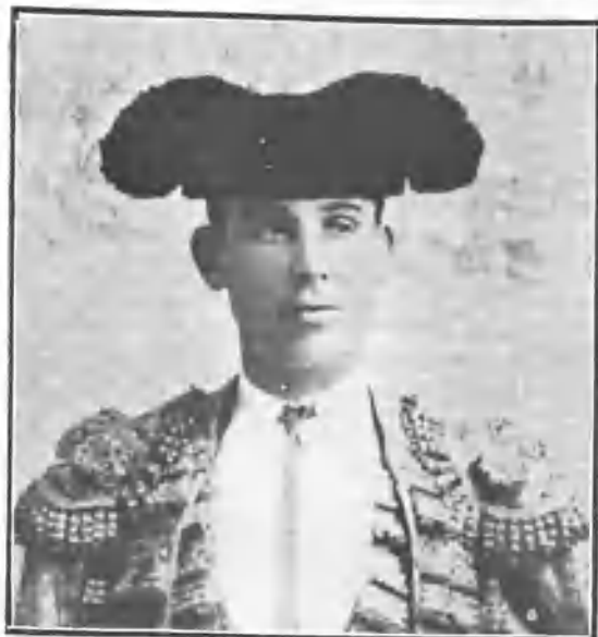
GUERRITA EN 1887

Lo que ha variado poco es la media, y milagro será que no salga alguno que las use á listas para afeminar en lo posible lo poco que nos queda de puramente varonil.