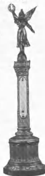
TERCER PREMIO TERMÓMETRO ARTÍSTICO

En nuestro segundo número del año próximo daremos cuenta detallada del resultado del Concurso, cuyos documentos (ya lo hemos dicho) están á disposición de quien desee consultarlos.