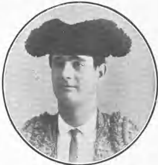
MONTERA DE HACE VEINTE AÑOS