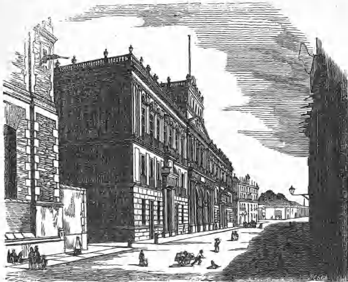
(Palacio de la Minería en Méjico.)

Para pagar el primer tributo indispensable á la edad, del cual no puede eximirse nadie que sienta palpar un corazón generoso y lozano, abrí mis ojos ante la muger, y creí ver en ella el cielo de mis esperanzas. ¡Qué purísima felicidad soñó mi fantasía ver realizada