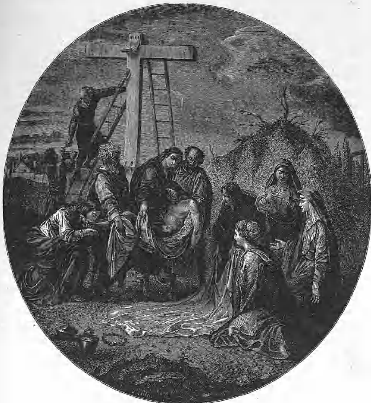
EL DESCENDIMIENTO DE LA CRUZ.

Lesueur es el autor del cuadro que tienen al frente nuestros lectores; el pintor, no solo ha sabido dar expresión á todas las figuras, imprimiendo á su composición el carácter severo y grave que requiere la escena sublime del Descendimiento, sino que ha conseguido presentar con novedad este episodio de la vida del Salvador, tantas veces representada en el lienzo por los artistas mas célebres del mundo.