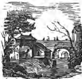
Puente y molinos de S. Lorenzo en Segovia.