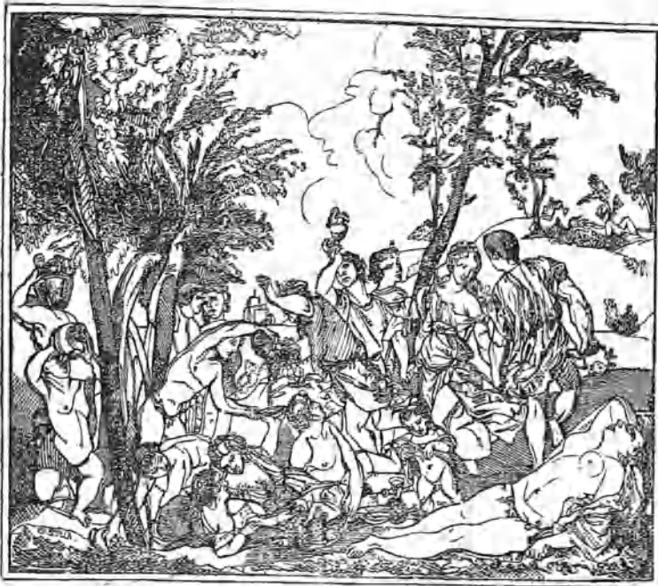
Bacanal, por el Ticiano.

Aunque en el catálogo del Real Museo se dice que este cuadro representa la venida de Baco á la isla de Naxos para consolar á Ariadna de haberla abandonado Teseo, y parece comprobarse esto mismo con el buque que á lo lejos navega viento en popa, y la figura de Sileno recostado en una alturita, no se vé en todo el cuadro señal alguna que manifieste claramente el hecho de que se trata, siendo á la verdad muy débiles los indicios por donde se conjetura. Lo que contiene, sin género de duda, es una Bacanal en pais ameno, á orillas del mar; árboles frondosos con parras enlazadas le hermosean; jóvenes de ambos sexos celebrando á Baco, le auiman; brilla la alegría por todas partes; óyese el bullicio de gentes inspiradas por el Dios de las vides; aquellos hablan, estos previenen con la taza las flautas; uno bebe, otro levanta el vaso como un trofeo, varios forman danza festiva entre el concurso, toman coronas ó las llevan puestas; una de las bacantes, y la mas bella de todas, se rinde al sueño: tampoco falta un gracioso niño que sin reparo hace delan-