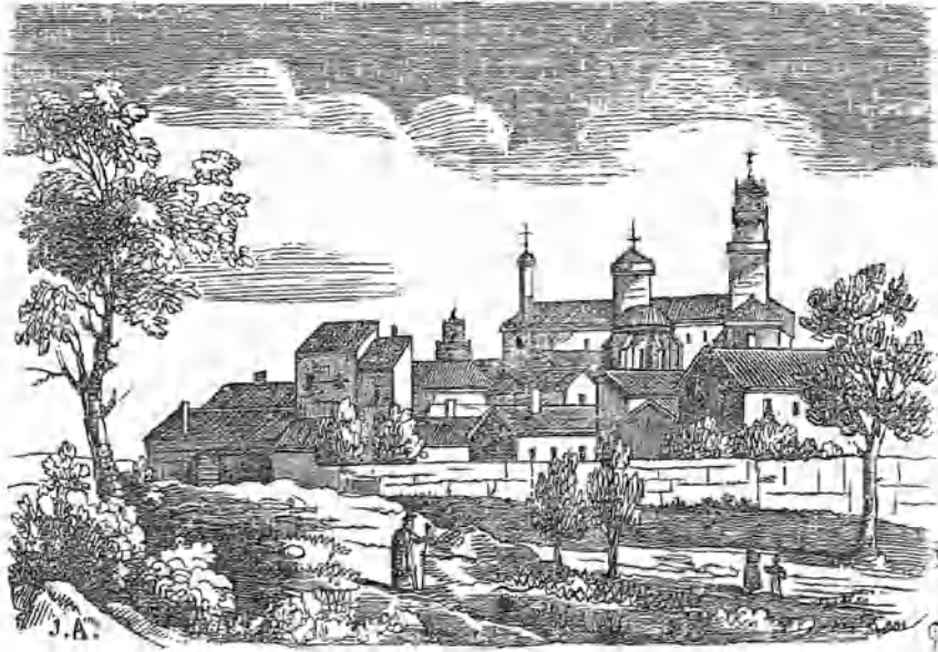
El Monasterio de las Huelgas de Burgos.

Fiel intérprete de las bellezas nacionales, que disfrazadas con el melancólico sudario de su decrepita edad aparecen en el círculo de los tiempos sin alterar su gravedad ni su profundo reposo, vuelve á llamar la atención pública nuestro Semanario hácia este monumento, el mas señalado en honras y privilegios, no solo del orden del Cister á que pertenece, sino tambien de todos los monasterios existentes en el orbe católico. De nada serviría una reseña física de las Huelgas , si pretendieramos hacer mérito de sus remontados timbres; porque estos parecen desmentidos en los agudos y monotonos fastiales de que abunda el edificio, en el remate desairado de su torre, y en sus inmensos patios circundados de unas paredes tan antiguas como sombrías: preciso es, pues considerarle bajo un aspecto mas ilustre, enseñando á todo el mundo, tras una exterioridad vulgar, inmensos tesoros de circunstancias relevantes, dignas de nuestro suelo, de los tiempos caballerescos á que se refieren, y del espíritu religioso de D. Alfonso VIII.