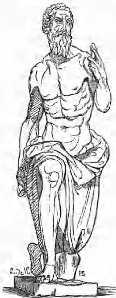
(S. Gerónimo. — Estatua de Torrigiano.)

Esta estatua, de barro cocido, es justamente considerada como una de las mas bellas producciones de escultura moderna, que existen en España. La modeló el célebre Pietro Torrigiano, escultor Florentino, que floreció á principios del siglo XVI, primero en Florencia, despues en Roma, y finalmente en Granada y en Sevilla, pues vino á España, con otros muchos artistas italianos, á quienes el oro de las Indias obligaba á abandonar su hermoso clima natal. Esta estatua estuvo primeramente colocada en una especie de gruta, donde recibía muy mala luz, por cuya razon fue trasladada al convento de Geró-