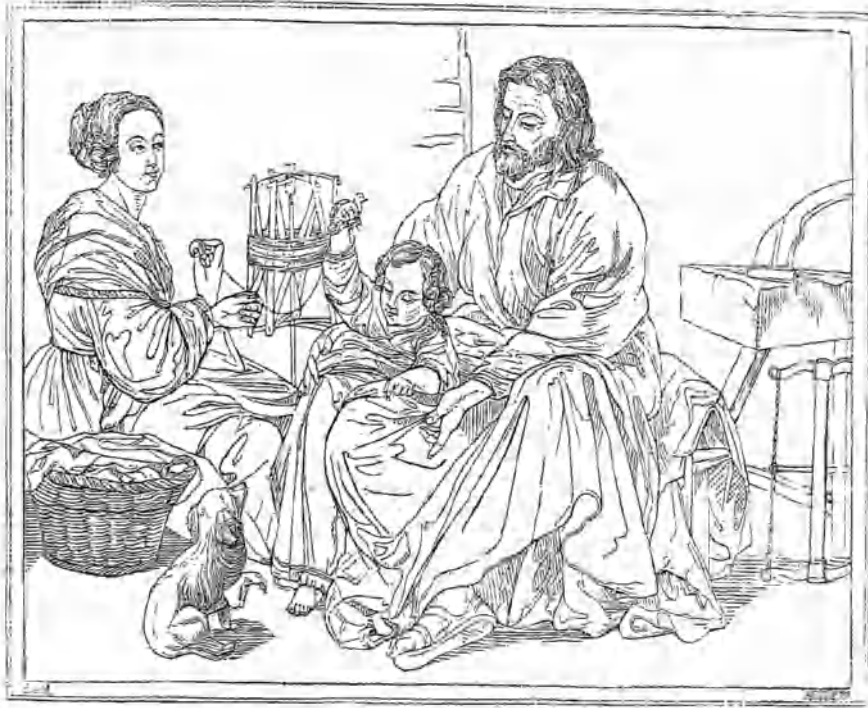
(Sacra familia.—Cuadro de Murillo.)

La felicidad, aquel bien de todos los hombres deseado, que por lo comun huye de los que con mas ansia le buscan, abandonando las c6rtés, los palacios, los puestos elevados, las tiendas de los guerreros, los brillantes concursos, donde rara vez se aplaude el mérito, pocas el talento, muchas el vicio, casi siempre la vanidad, suele refugiarse á las rústicas cabañas, á los humildes talleres, á las mansiones sosegadas, retiradas, ignoradas del mundo. No viste oro ni seda, no se adorna con joyas, no ciñe la espada, no empuña el baston; con modesto traje se complace en residir en medio de una familia oscura y pobre, pero honesta, enjugando el sudor del padre de familias, aliviando los afanes de la esposa, acariciando la inocencia de los hijuelos. Mas si adormecidos por los falsos placeres que ha inventado el arte en las sociedades civilizadas, dudamos de cosa tan clara y verdadera, volvamos los ojos al presente cuadro, y al contemplarle sentiremos que desterrado de nuestro corazon el bullicio de las pasiones, sucede en él la calma y la tranquilidad. ¿Y quién produce este encanto? ¿Qué nos retrata aquí el pincel de Murillo? ¿Qué vemos en este lienzo? Un aposento reducido y sin