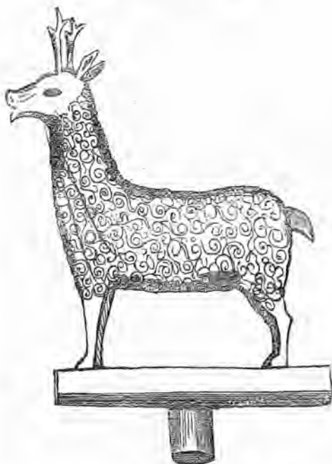
EL CIERVO DE BRONCE.

En el sitio llamado Córdoba la Vieja, donde se encuentran frecuentes vestigios de la tan celebrada casa de Recreacion, que el año de la egira 325, construyó Abderramen III, y despues hizo ciudad con el nombre de Azahra, fueron hallados una taza de fuente y un ciervo, y una cierva de bronce. El ciervo y la pila se conservaban en el citado monasterio de San Gerónimo; y la cierva fué conducida al de Guadalupe, donde la colocaron en la fuente que estaba delante del refectorio. El ciervo, lo mismo es de creer fuese la cierva, está hueco y dispuesto para arrojar agua por la boca, que debia de entrarle por el conducto que se vé en la basa donde está colocado. Tanto la pila como estas toscas esculturas árabes, pertenecieron sin duda á alguna de las fuentes de aquel admirable y suntuoso alcázar.