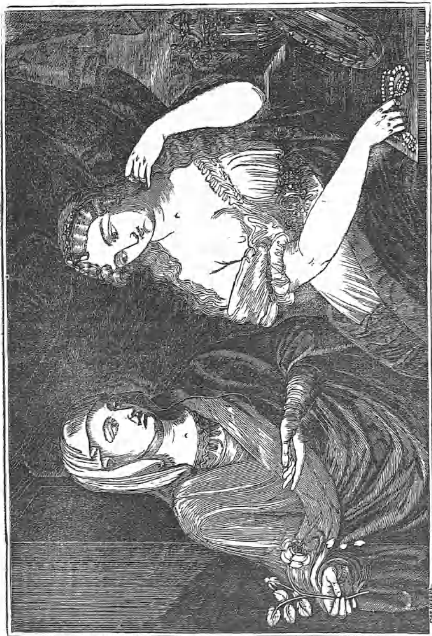
La Prudencia y la Hermosura.

Cuadro original pintado por D. VALENTIN CORDERERA.