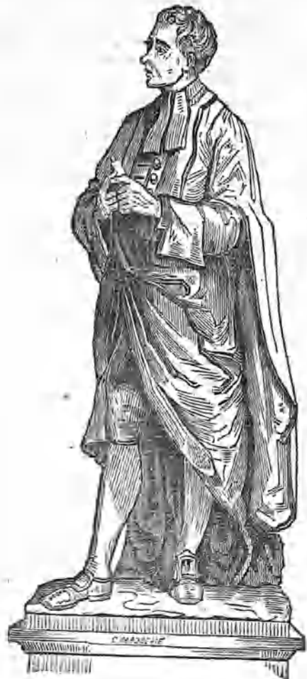
(Está ya de Newton en Cambridge.)

parte de su vida. Se advierte solo en ella que dió un aire excesivo de viveza á un personaje tan grave como fue Newton.