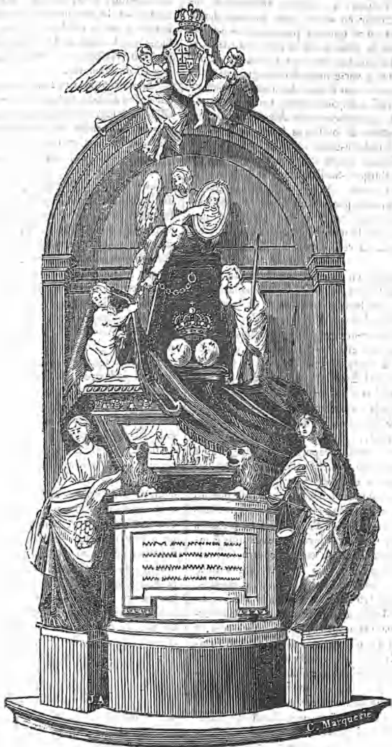
SEPULCRO DE FERNANDO EL VI EN LAS SALESAS.

E n todas las naciones gobernadas por monarcas los enterramientos de éstos han servido para consignar el grado de esplendor y de grandeza a que llegaron las bellas artes. Compitiendo á porfía en tales ocasiones para consignar en durables monumentos las acciones de los monarcas difuntos, y llamando tambien en su auxilio los poderosos estímulos del orgullo ó de la adulacion de los pueblos, han escrito sobre sus sepulcros una página material en que viene á veces á resumirse la historia del progreso que tuvieron en cada reinado. En los tiempos antiguos pudo ser mas exacta esta observacion, y las pirámides de Egipto y el sepulcro de Adriano en Roma, ates-