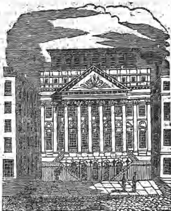
(Palacio del Lord-Corregidor.)

pesado, que se aumenta por haberle sobre cargado con un piso superior que le desfigura y hace muy mal efecto. Mucho mas digna de elogio es la reparticion interior del edificio. Al entrar por la fachada principal se encuentra una sala espaciosa por la que se va á la de convite que tiene unos 90 pies de oeste á este y unos 60 de ancho. Llámase sala egipcia aunque ninguno de sus adornos tiene analogia con tal nombre, su techo abovedado tiene varias divisiones y está bien decorado. Esta sala comunica con la Sala de justicia , con la del portador de espada , y con otra muy linda llamada Wilkes parlour . Hay en el segundo piso diferentes piezas preciosamente amuebladas, pero generalmente oscuras, entre las que es notable una sala de baile, otra de recibimiento y un hermoso dormitorio con una cama colgada con toda magnificencia.