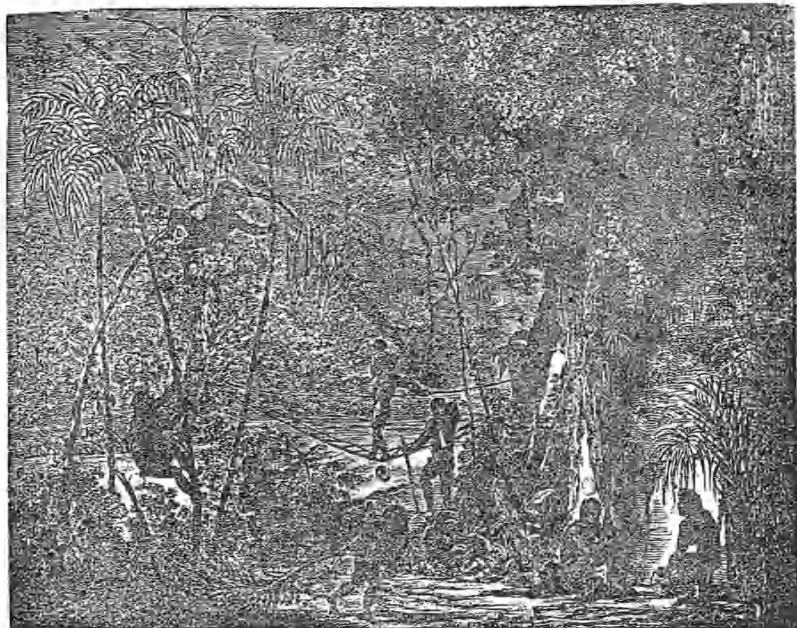
(El puente de lianas.

mas que cargan las mugeres á la espalda, sujetándole á la frente con una cuerda, de suerte que sobre la cabeza el mayor peso, y llevan además las provisiones y un par de hijos. Los hombres van delante sin otro peso que su arco y sus saetas; porque los mas fuertes por donde quiera oprimen á los mas débiles, y se aprovechan de su superioridad para distribuir los trabajos y gozas del modo mas opuesto á la justicia y á la razon.