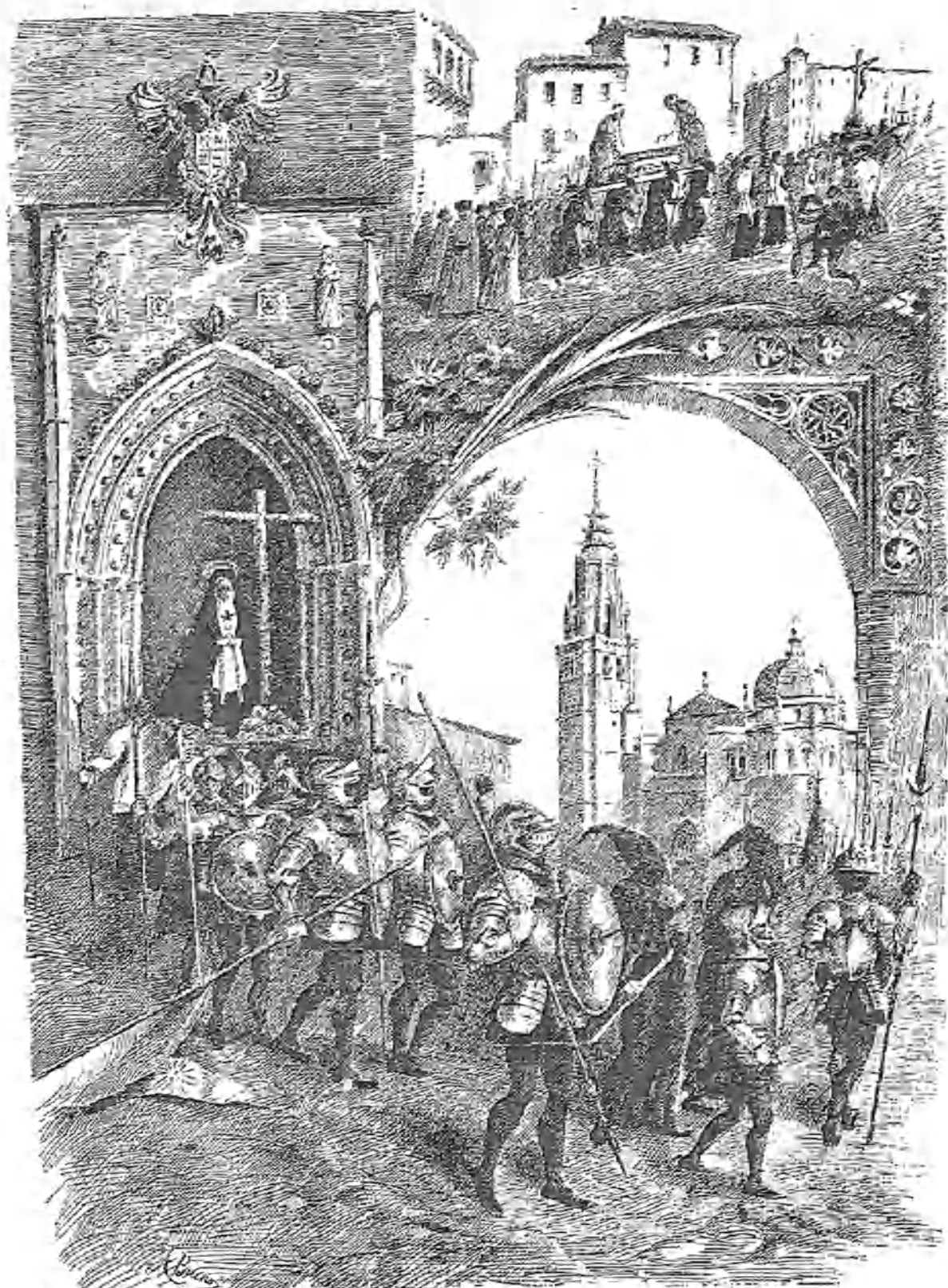
LA PROCESION DEL SANTO ENTIERRO EN TOLEDO