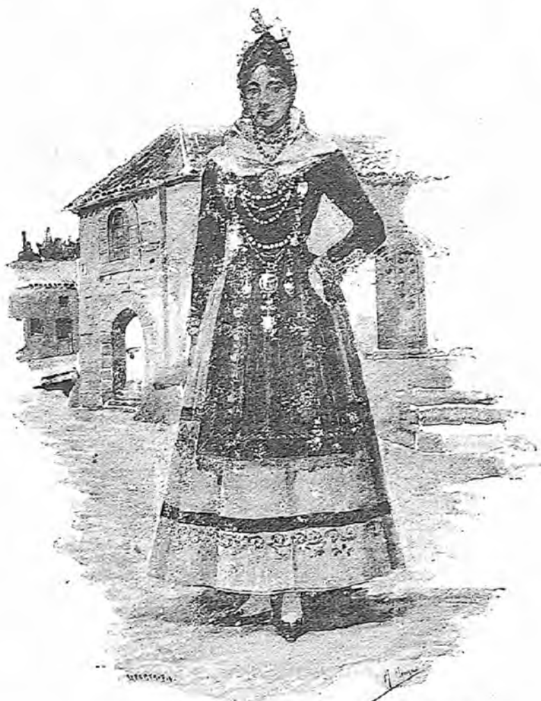
SEGOVIANA EN SU TRAJE CARACTERÍSTICO