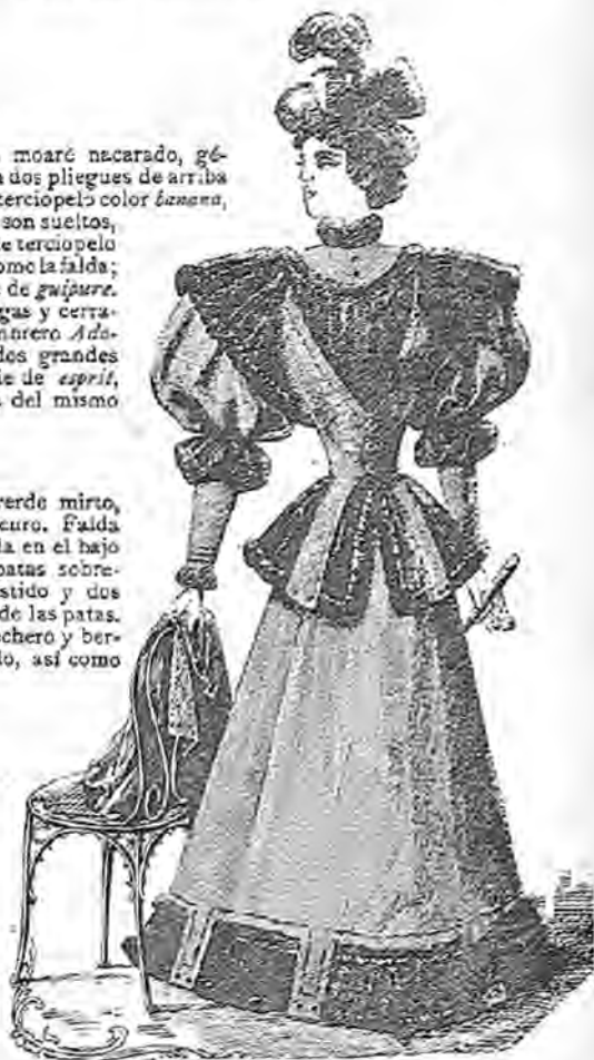
Núm. 2.—Traje de paseo.