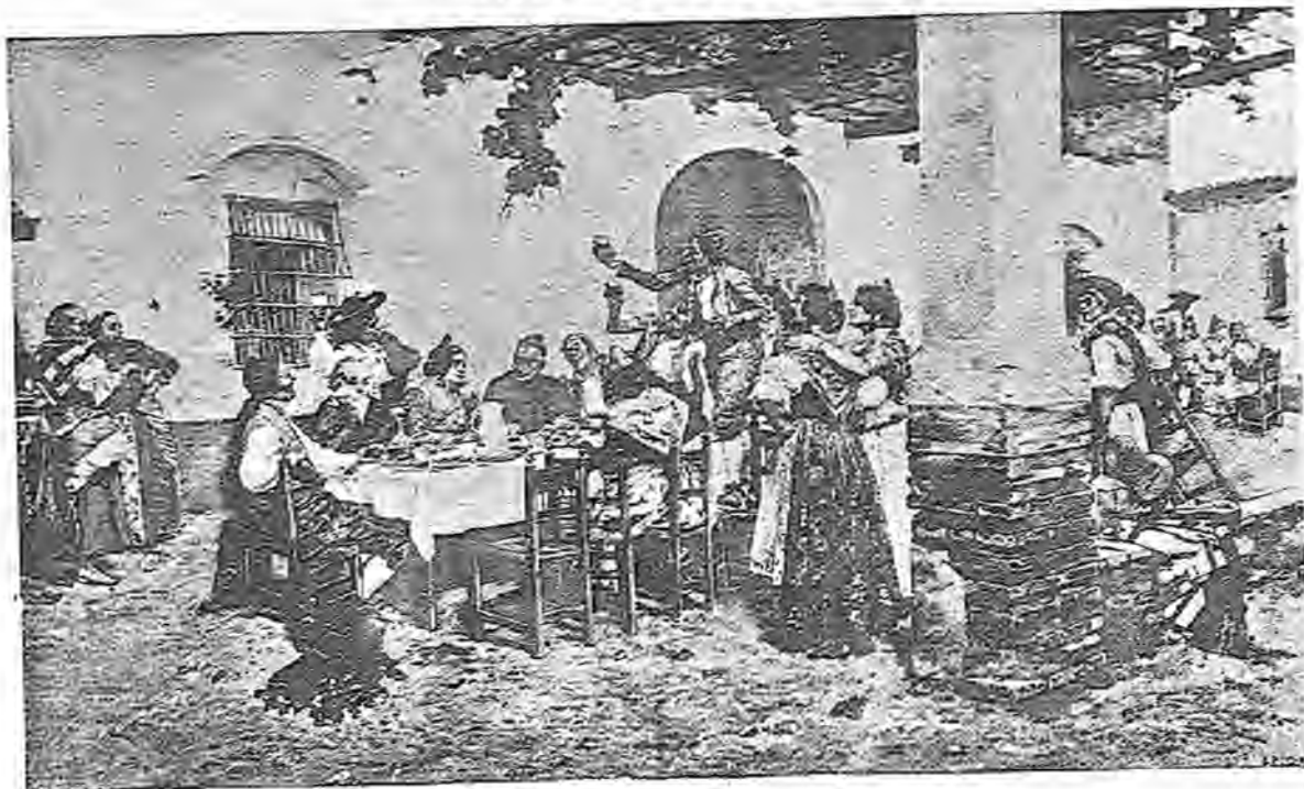
A LA SALUD DE LA NOVIA

(CUADRO DEL LAUREADO PINTOR D. JOAQUÍN AGRASOT)