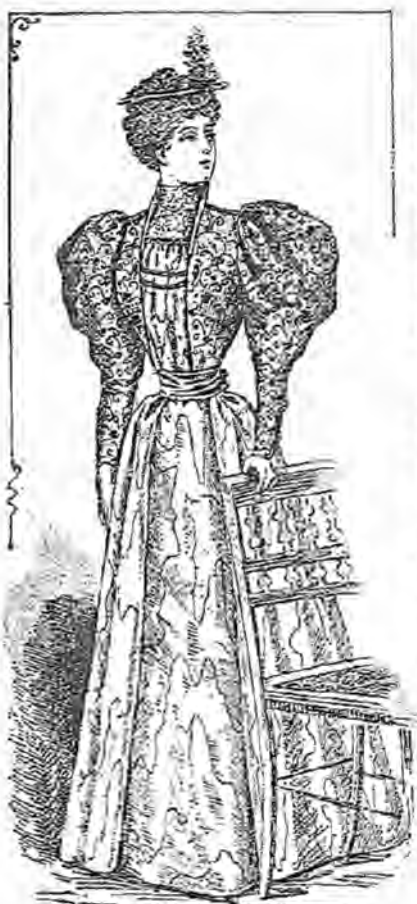
Núm. 1.—Traje de visitas.