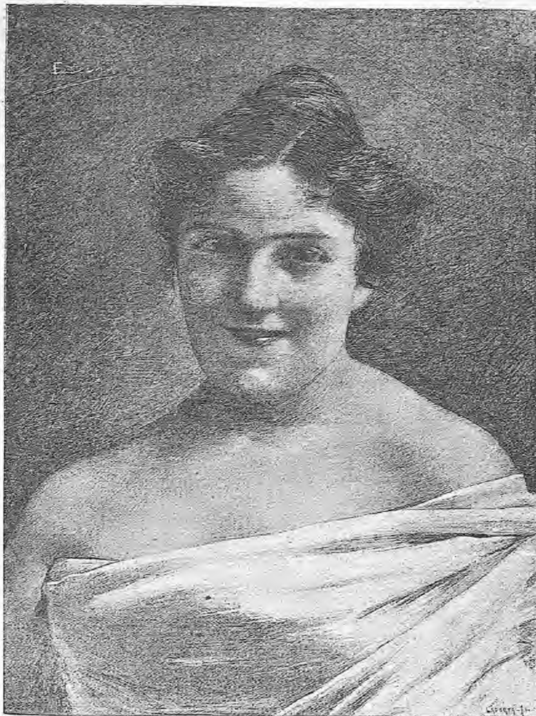
ESTUDIO DEL NATURAL (DIBUJO DE D. ENRIQUE ESTEVAN)