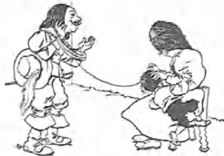
5. —¡El amor... siempre el amor...