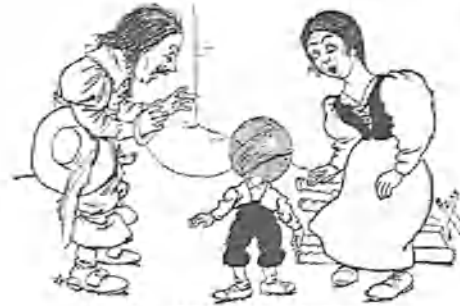
6. —¡...haciendo disparates!