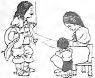
4. —Oh, qué hermoso es tener la hebra!