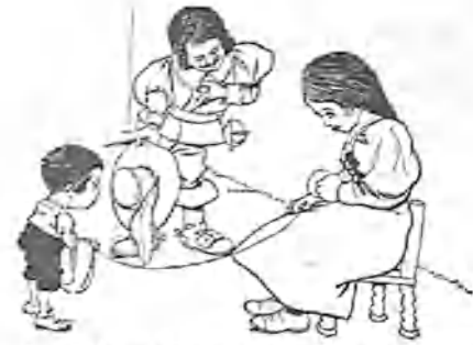
3. —¿Sería usted tan amable que me permitiese tener la madeja?