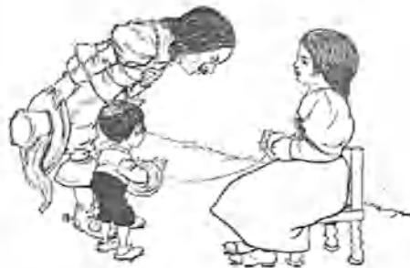
2. —¡A los pies de usted, señorita!