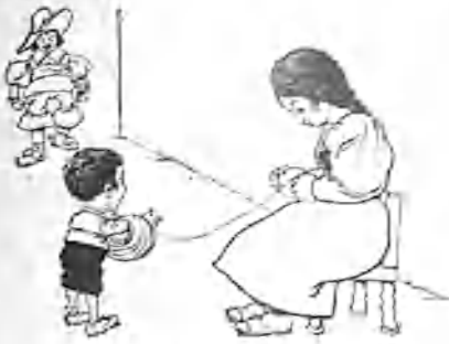
1. —Anda, niño; qué falta poco.