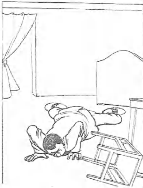
- 3 -