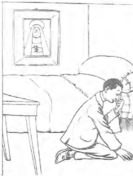
- 5 -

Trabaja, cerebro, y compadece á este vicioso..