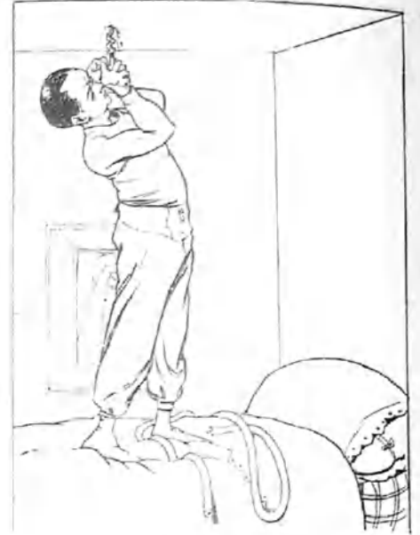
- 6 -

Antes dan con la dirección de los globos que yo encuentre alguna.