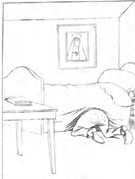
- 4 -

-Eso de tener pocas ganas de estudiar y además carecer de tabaco, es verdaderamente horrible.