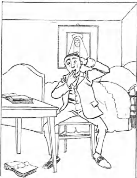
- 1 -

-Eso de tener pocas ganas de estudiar y además carecer de tabaco, es verdaderamente horrible.