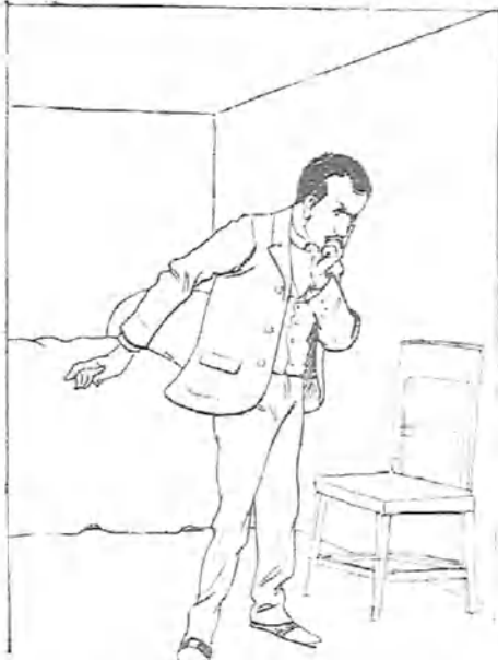
- 2 -