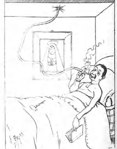
- 7 -

Trabaja, cerebro, y compadece á este vicioso..