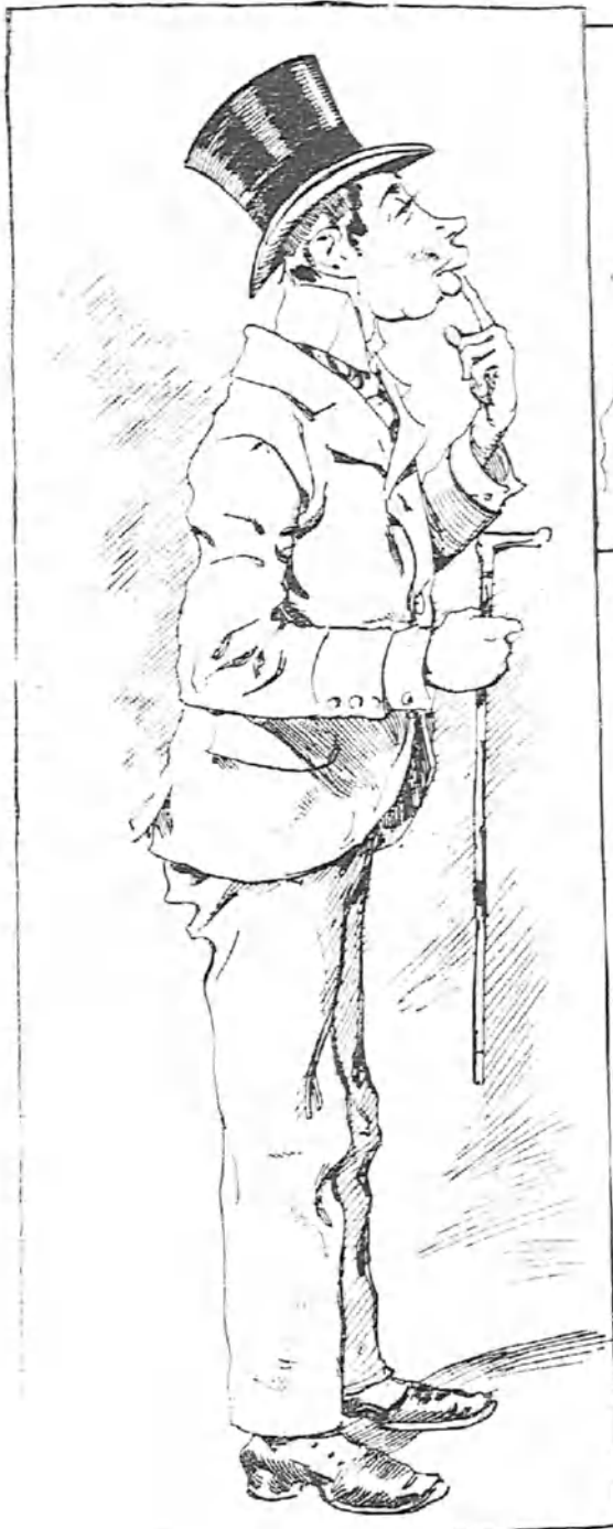
—¡Colindres! ¿Cómo viaja el czar! ¿Quién fuera czar! Y ya que eso no pueda ser, ¡quién fuera zarina, por lo menos!