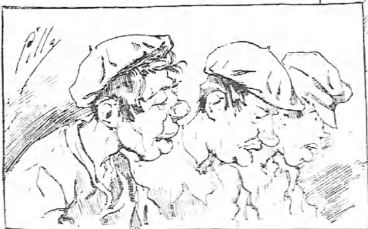
Situación actual del pueblo español hasta ver en que para esto.