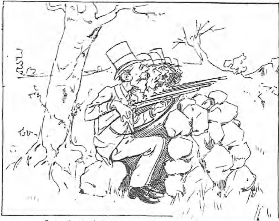
Los señores críticos de tercera clase esperando el estreno de la última obra de D. José Echegaray.