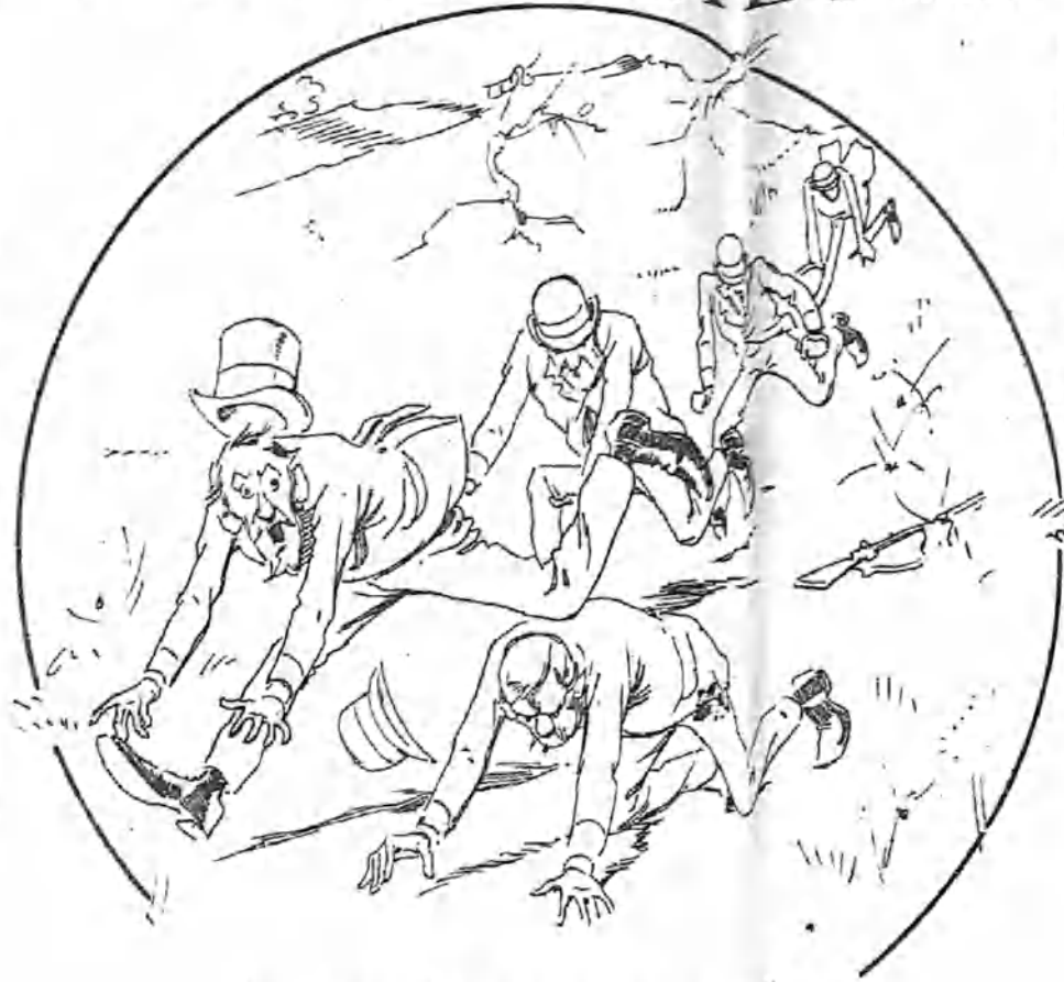
Los mismos señores críticos al día siguiente.