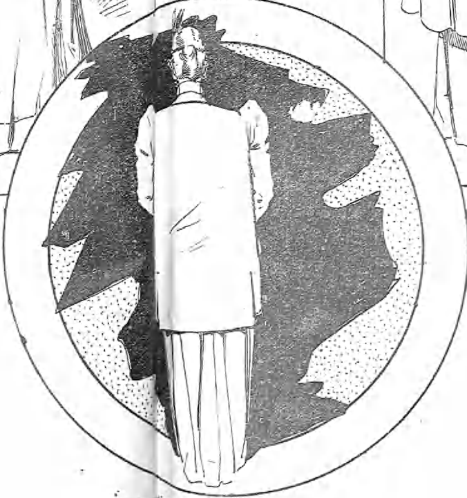
Para distinguirse de los demás mortales.