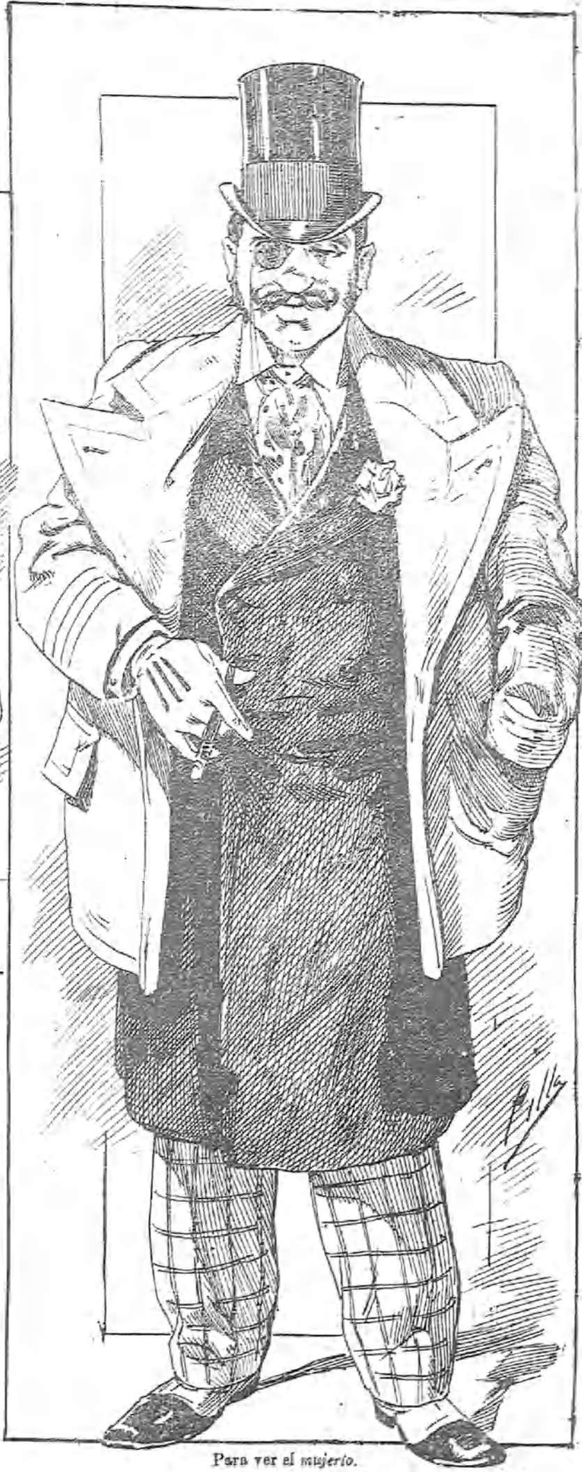
Para ver el misterio.