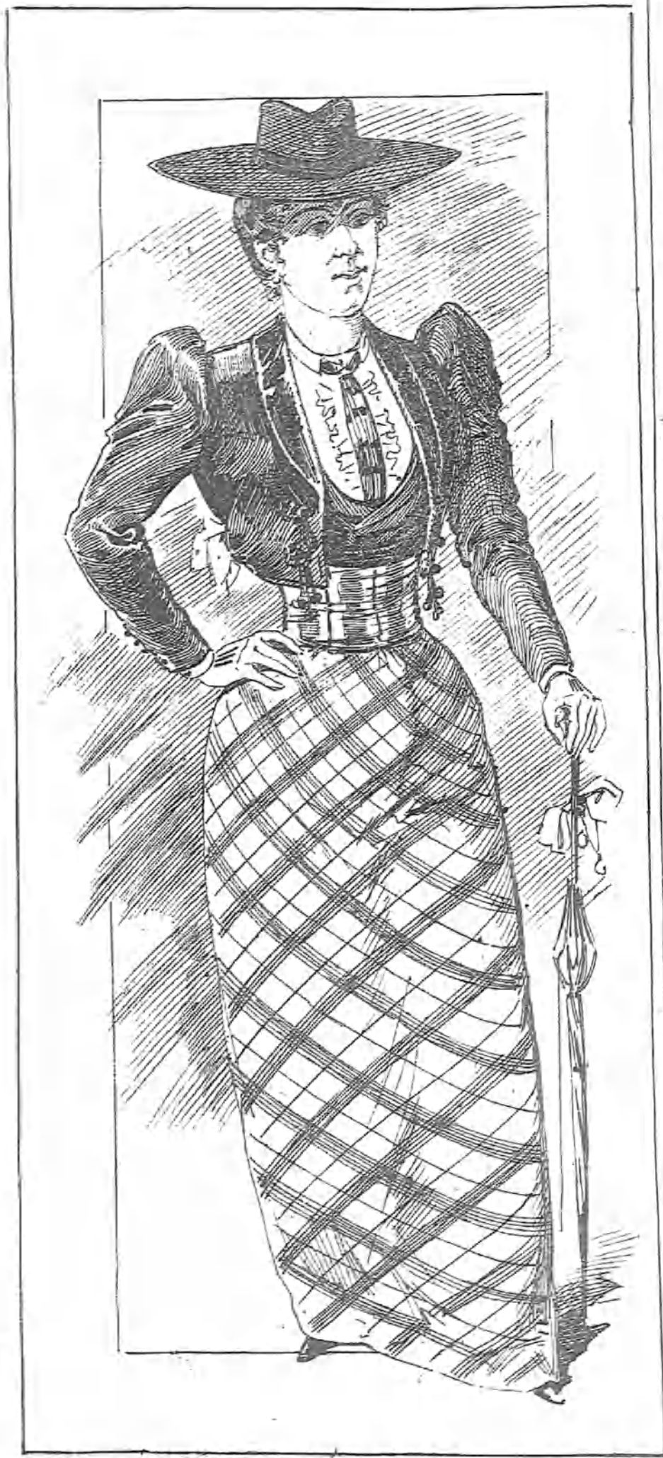
Para salir pidiendo pelea.