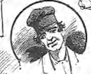
¡Cómo ze marcabal