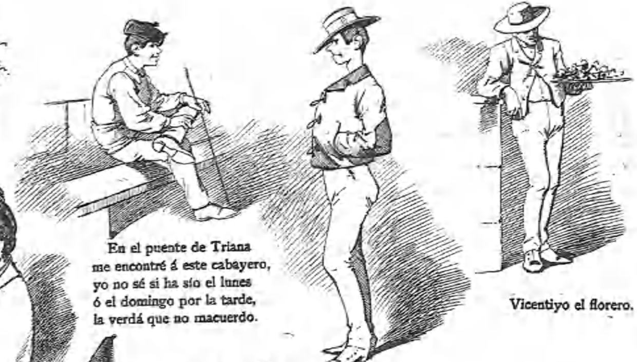
En el puente de Triana me encontré á este cabayero, yo no sé si ha sido el lunes ó el domingo por la tarde, la verdá que no macuerdo.