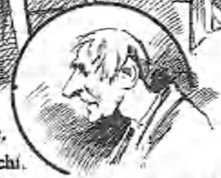
¡Cómo ze marcabal!