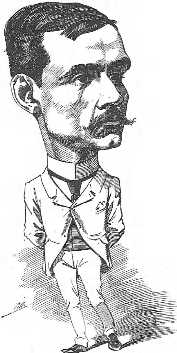
El director del Cronista es un muchacho modesto, excelente novelista y muy digno de su puesto.