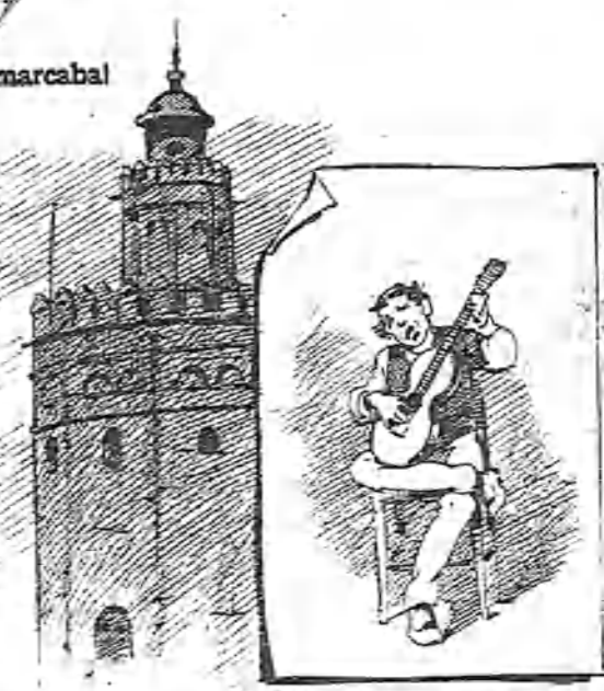
Las peniyas que se cantan son las peniyas más grandes, porque se cantan llorando y las lágrimas no salen.