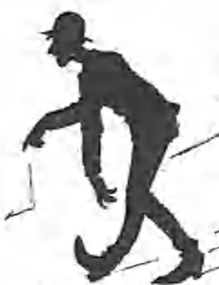
Un señorito que se va á acostar bien acompañado.