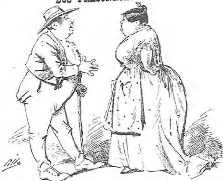
Ella ha sido mondonguera y ha nacido en Almorchón. Él procede del Peñón, del Peñón de la Gomera.