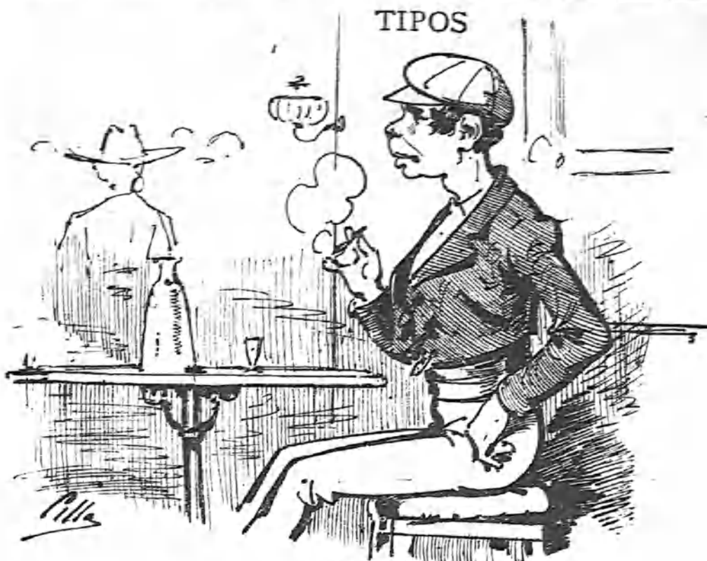
Devoto del aguardiente con honores de aguarrás, que toma generalmente... lo que pierden los demás.