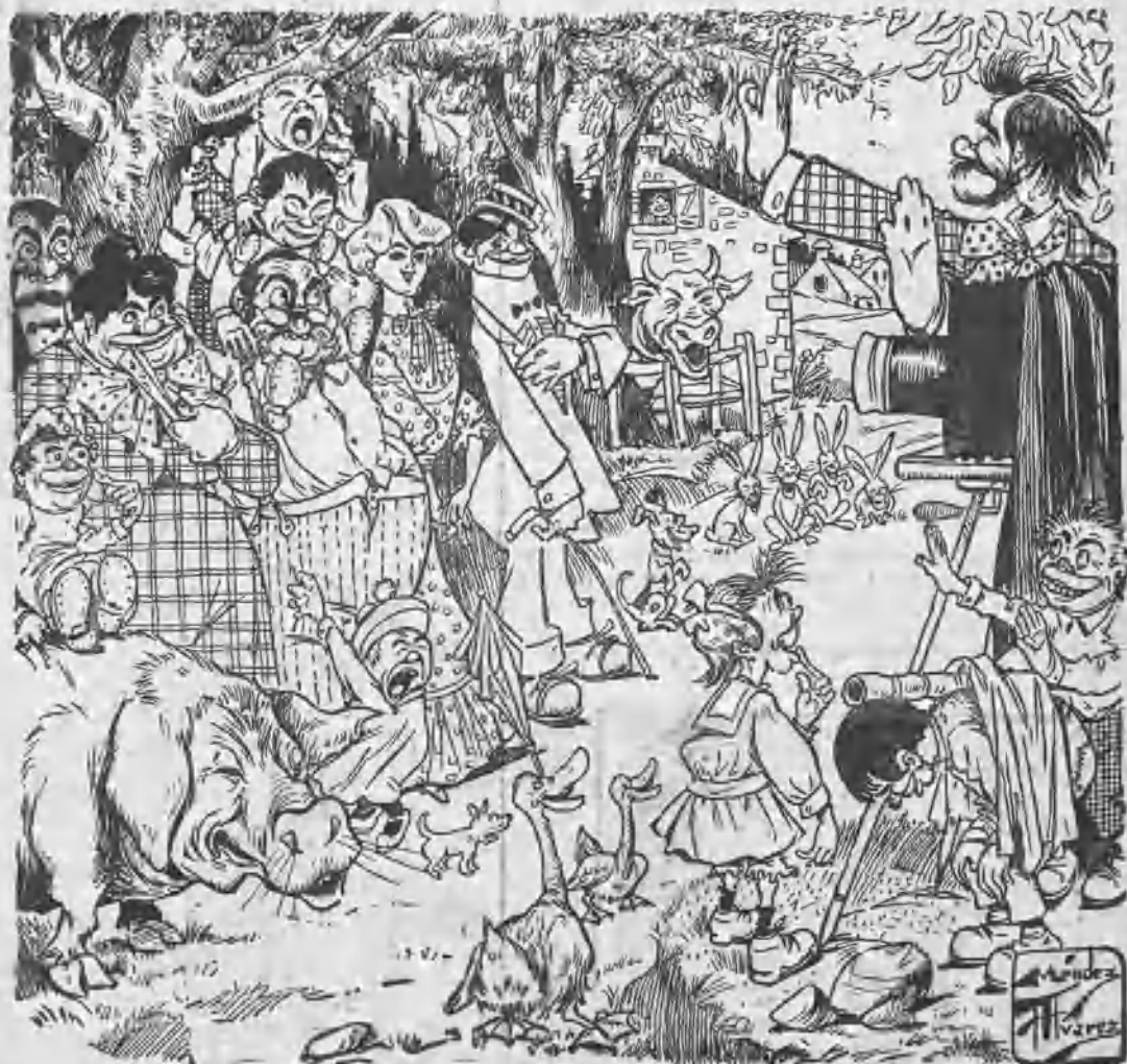
EL FOTÓGRAFO AMBULANTE