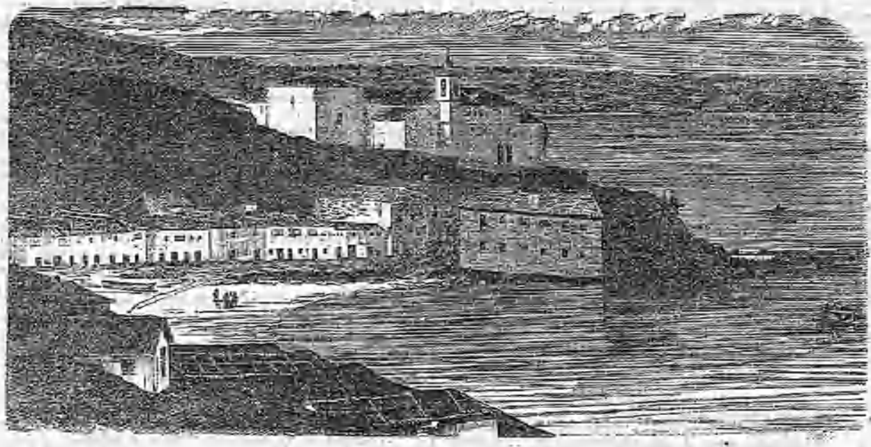
La ribera de San Francisco en Vigo.

Multitud de riachuelos, y son ríos caudalosos. Hacen el tributo de sus aguas á esos lagos, que además comunican entre sí por medio de anchos canales á que Livingstone ha dado el nombre de lacustrine rivers , ríos lacustres.