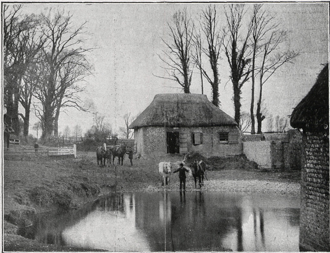
6.—Paisaje inglés: Campiña de Escocia.—Fot. The Platinotype Company (Londres).