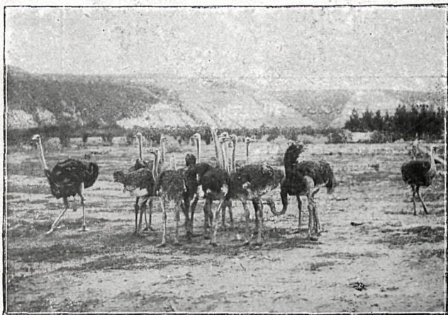
7.—Rodeo de avestruces (Africa del Sur).

Luisito había recibido el retrato de Pepa y estaba loco de alegría: su futura era una criatura encantadora; se pasaba las horas muertas contemplando el retrato, y cuando hablaba con ella lo colocaba sobre el aparato para hacerse la ilusión completa de que estaban juntos.