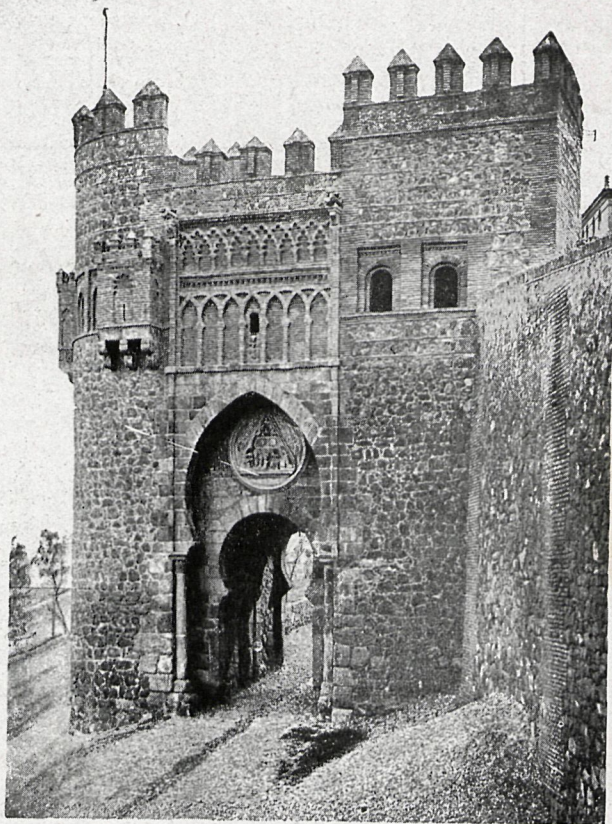
5.—Puerta del Sol (Toledo).