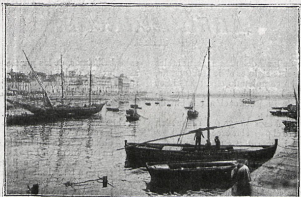
4.—Paseo de la Dársena (Coruña).