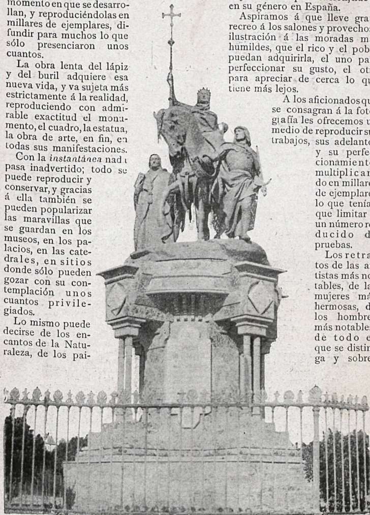
3.—Monumento de Isabel la Católica (Madrid).

Los retratos de las artistas más notables, de las mujeres más hermosas, de los hombres más notables, de todo el que se distingue y sobre-