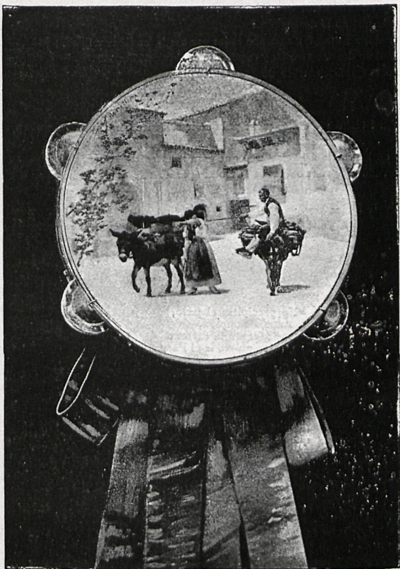
8.—Asunto aragonés: El Saludo.