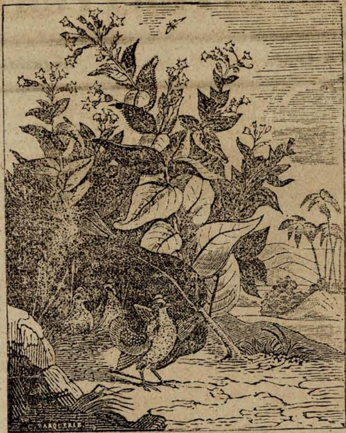
PLANTA DEL TABACO.