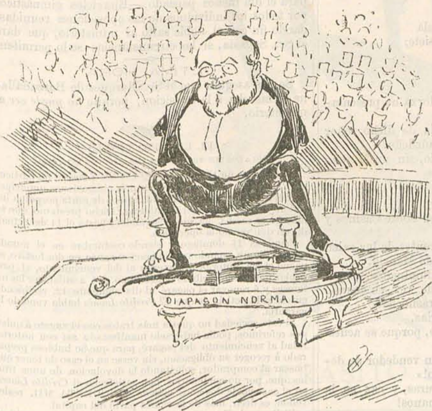
Todo, lector, como ves, lo hace el hombre con los pies.