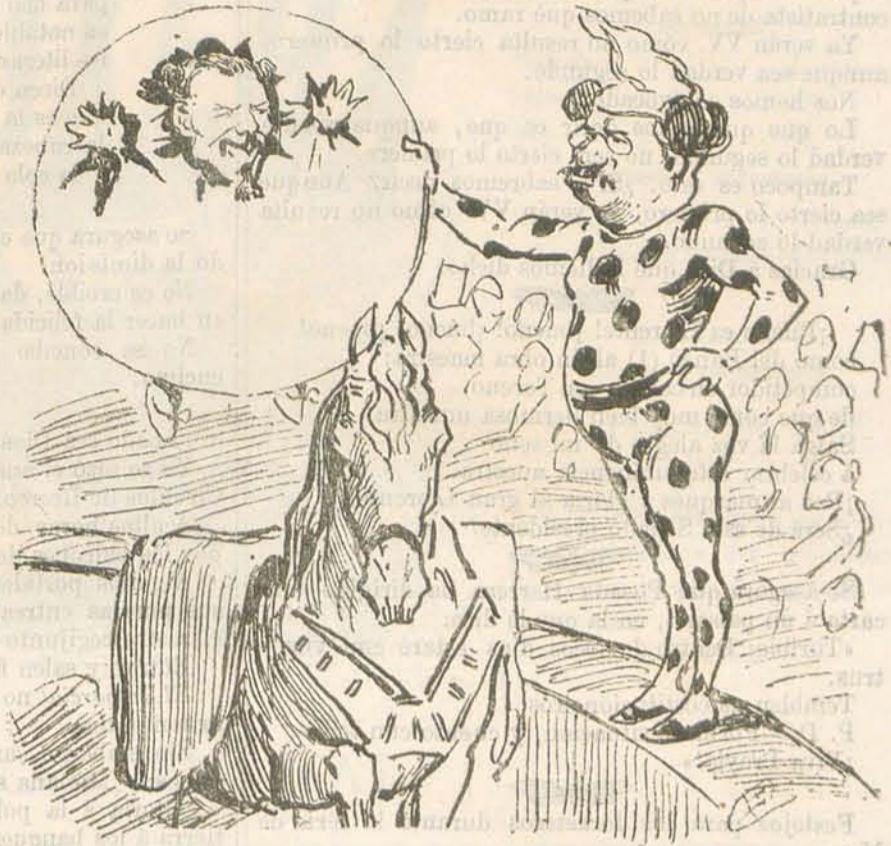
Es gran gimnasta, y declaro que pasa bien por el aro.