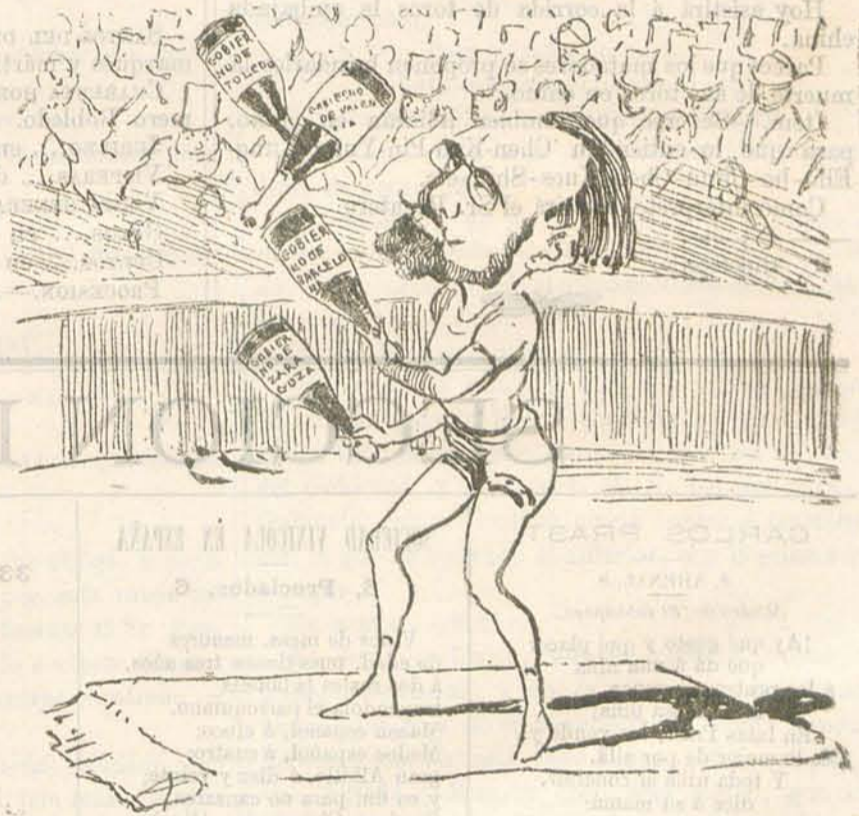
Estos juegos malabares te darán muchos pesares.

si tú eres la encina yo soy la bellota, etc., etc. Luego se ocupa de la vida miserable y triste, y dice el vate de los dátiles: «LA VIDA» Hasta aquí no hay nada de particular: despues comprenderán VV. que haya tantos partidarios de la pena de muerte. «Apenas dulce del alba amiga, la luz risueña tímida brilla, cuando lejana tiende, indecisa, la tarde triste sus vagas tintas. Pasan las noches, pasan los días, pasan los años, pasa la vida.»