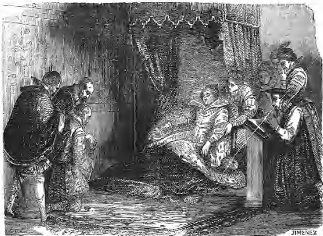
Muerte de Isabel.

rés, preciosas é infinitas láminas iluminadas con esmero y numerosos grabados en madera que sirven para ilustrar el texto. No se notan en este los galicismos é incorrecciones que afean generalmente las publicaciones de Barcelona; el texto de El Globo no es una traduccion, es un escrito de mas pretensiones y la edicion es limpia y clara cuanto puede serlo una obra de lujo. Pocas de este género pueden citarse que reunan en tan alto grado las condiciones de intereses general y de recreo, ni que sean mas á propósito para servir de album en los salones.