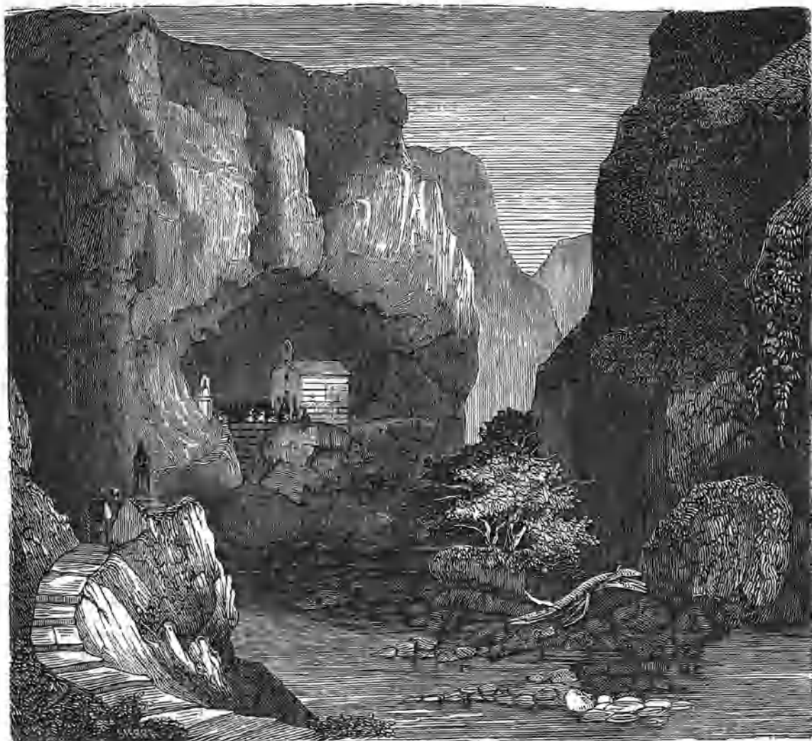
La gruta de S. Pablo en Sicilia.