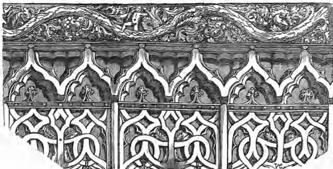
Detalle de una capilla de la catedral de Murcia.