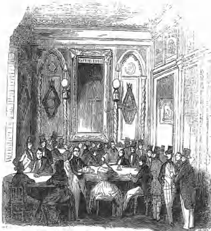
(Vista del salón gótico del café del Espejo.)

dido de omnibus en el interior de la poblacion: sería por lo tanto de desear, que el Ayuntamiento concediendo algun privilegio de corta duracion, escitara á las empresas que quisieran plantear este género de carruajes adoptando el método mas conveniente en su itinerario; pues la falta de este requisito indispensable, fué la sola causa