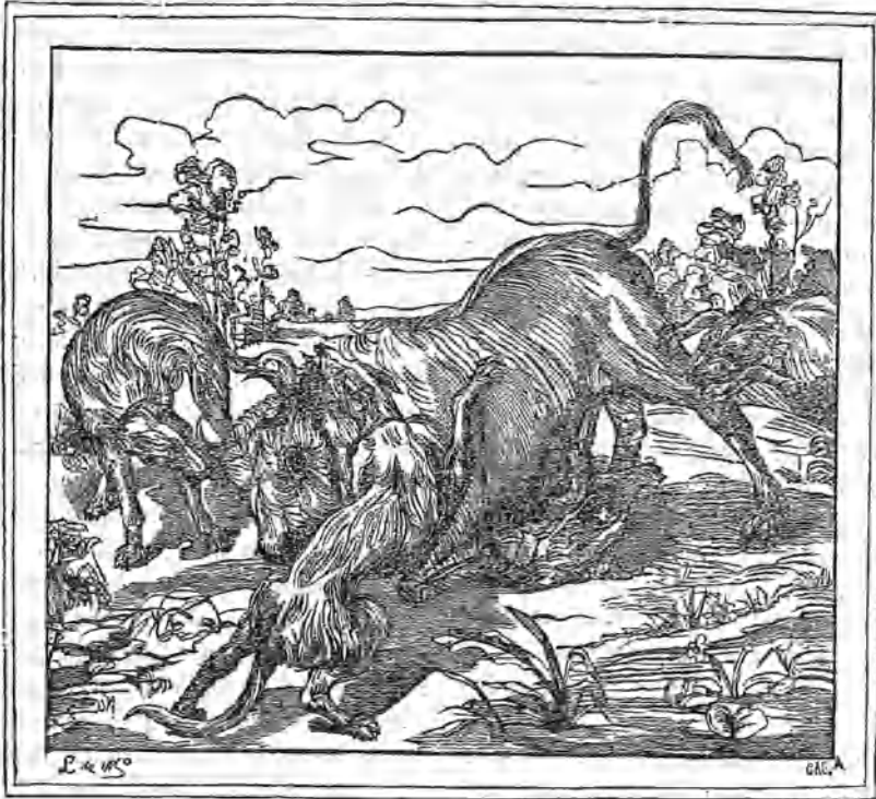
(Toro rendido por Perros.—Cuadro de Pablo de Vos.)

Dos cuadros hay en el Real Museo que representan un toro rendido ya por algunos perros, que le han acometido: uno de Snyder, el pintor que acaso ha sobresalido mas en este género; otro de Pablo de Vos, que es el actual, y que por cierto no desdice del pincel de su compañero; tal es la espresion en los ademanes de los brutos, y la frescura y naturalidad del colorido. Lo que figura es esto. En una frondosa cañada, en terreno húmedo, junto á lagunas donde se cría el nenúfar y otras plantas acuáticas, varios perros embisten á un toro pio, sin duda el mas valiente de la torada. Impele á los vuos su natural fiereza: el otro, de suyo pacífico como animal rumiante, pero corpulento, forzado, de esquivia condición y con armas agudas y temibles, se irrita y apercibe á la pelea. No le es difícil arrojar al suelo al primero de sus contrarios, que derribado se defiende en vano con las uñas, y ladra rabioso. El fornido bruto se le echa encima; pero es imposible que resista al número de los enemigos. Dos de ellos mas afortunados y atrevidos le asen de las orejas, el toro se sacude con violencia; los otros siguen