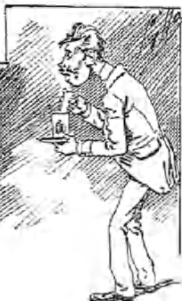
Don Simplicio Badalque, redactor del «Catalismo lumbante», que toma notas de la reunión para su periódico, toma chocolate con el dueño de la casa, y toma doce vasos de agua con doce azucarillos... cada vaso.