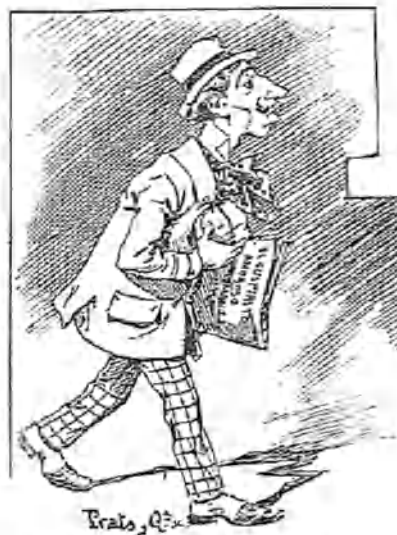
Remigio Mantequín, que lleva todas las noches un paquetito de caramelos (procedentes de un saldo) para las señoras; un traje precioso de la calle de la Cruz, para dar envidia á los caballeros, y su hermosa voz de barítono para alterar el sistema nervioso de cuantos tienen la dicha de escucharla.