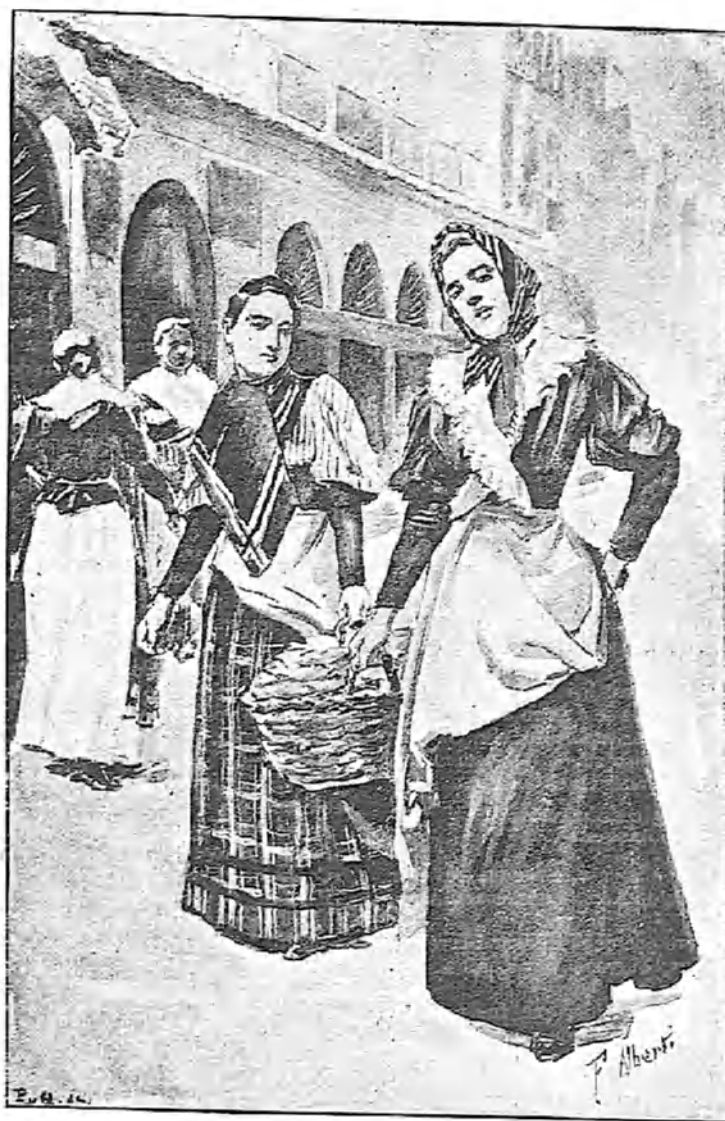
EL MERCADO.—VENDEDORAS AMBULANTES