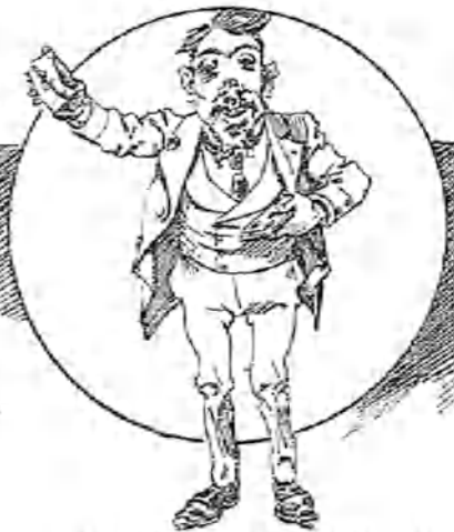
Don Aniceto Pestaña, gran aficionado á hacer juegos de manos y á escarlar á uno el maldito de los ojos, pongo por caso, por las narices, los oídos, etc., etc.