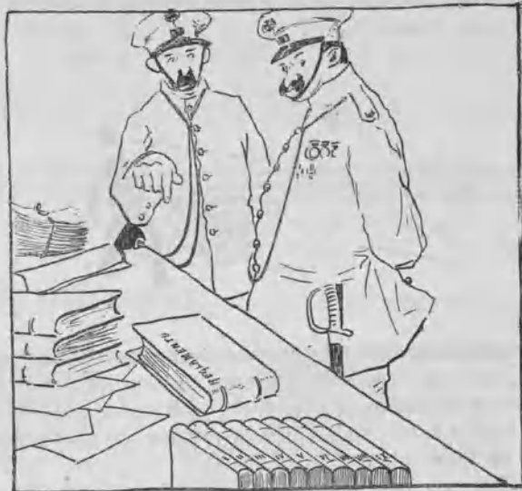
Reforma de la policía.

Es un modo como otro cualquiera de conseguir heridos para su hospital.