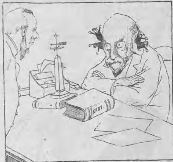
La enfermedad de moda.

— Esa francesa que ves ahí, querido Mohamed, se ha disfrazado frecuentemente durante sus viajes. Ya ha sido hebrea, ha sido mora y hasta ha sido judía varias veces.