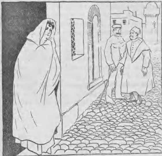
Madame Du Gast en Marruecos.

— Todos. Y aún faltan entre esos pliggos un plano de los tejados de Madrid y un mapa de Alcorcón.