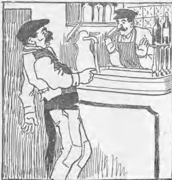
Contra la embriaguez.

— ¡Ay, chica! Si ahora no nos casamos, no nos casamos nunca. — ¿Porqué lo dices? — Porque ahora tenemos en Madrid más de dos mil isidros ricos, más de cuarenta obispos deseando echar bendiciones, seis príncipes extranjeros y catorce osos en la Zarzuela.