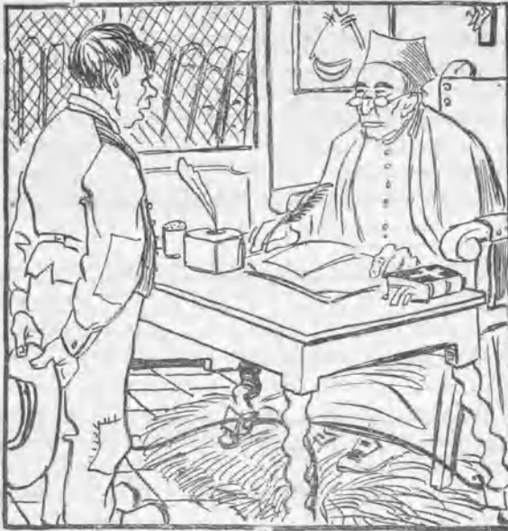
El movimiento cunde.

— ¿Y a qué vienes tú, grandísimo hereje, a casa del señor cura? — Pues a hacer las paces y a ver si quiere usted que fundemos la solidaridad en Membrillera de Abajo .