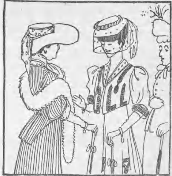
En plenas fiestas.

— ¿Y a qué vienes tú, grandísimo hereje, a casa del señor cura? — Pues a hacer las paces y a ver si quiere usted que fundemos la solidaridad en Membrillera de Abajo .