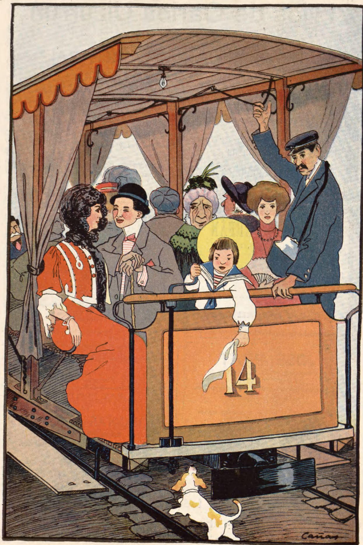
« Amor á la jardinera. »