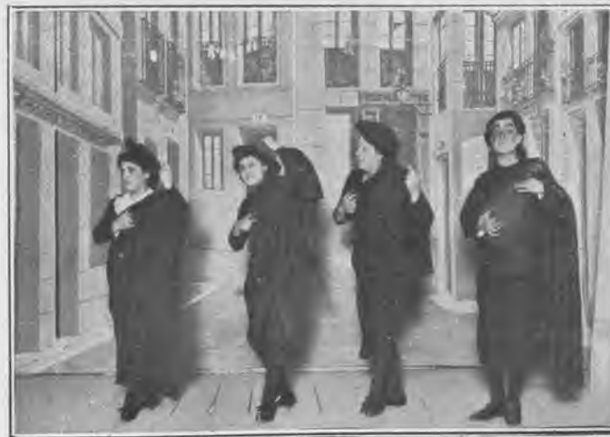
Serenata del primer cuadro.