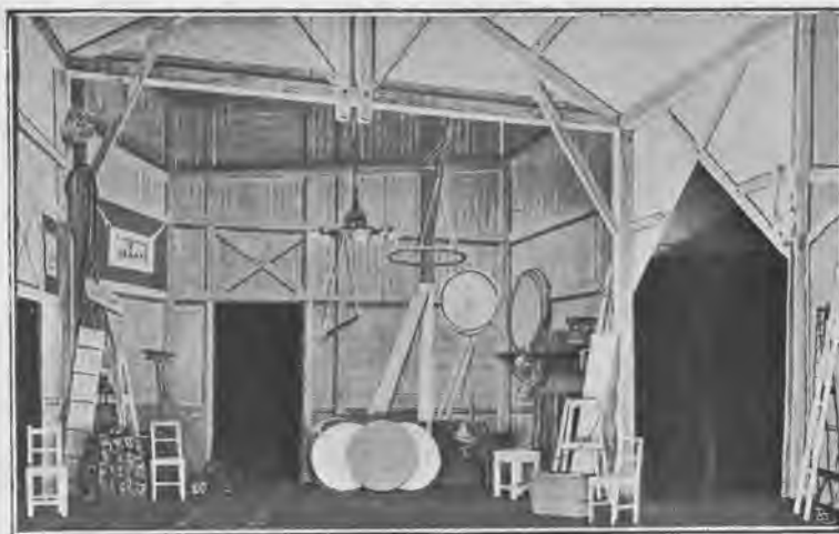
Decoración del acto II.

Toda esta evocación acuarelista y romántica vive con toda hermosura en la obra de Gregorio Martínez Sierra y Santiago Rusiñol, sobre todo en sus dos primeros actos, que son los mejores de la obra. Pero bajo toda esta apariencia, como el corazón bajo el vestido de Arlequín, palpita y vibra la vida con todas sus pasiones y todo su largo cortejo de sufrimientos. El acierto de los Sres. Martínez Sierra y Rusiñol al descubrir y presentar este ambiente ha sido grande. Como autores dramáticos han escrito una obra extraordinariamente teatral; la maestría de la pintura de los