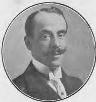
G. Martínez Sierra.

Unos titiriteros van en su carreta corriendo pueblos, los áridos pueblos del centro de España; han llegado á uno y es día de feria; por lo cual, en la plaza donde se ha detenido la carreta hay puestos de rosquillas y buñolerías, hay rifas, hay Tío-Vivo; están regando el suelo para que pase la procesión y preparando los castillos de fuegos artificiales que, llegada la noche, se han de quemar; dentro del barracón donde los títeres se han instalado, vibra el rumor de toda esta alegría colectiva en el corazón alegre de una chiquilla, Lina, que canta la alegría del vivir optimista é ilusionado, sin darle nombre á la ilusión, puesto que ella es tan joven y tan inocente que no ha sabido aún leerlo dentro de sí misma. Y canta la alegría del vi-