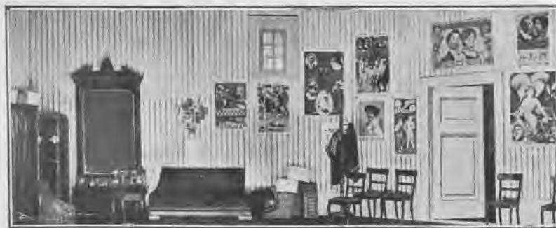
Decoración del acto III.