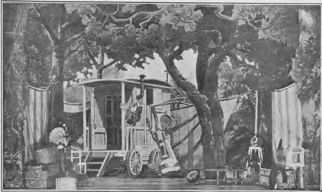
Decoración del acto primero.