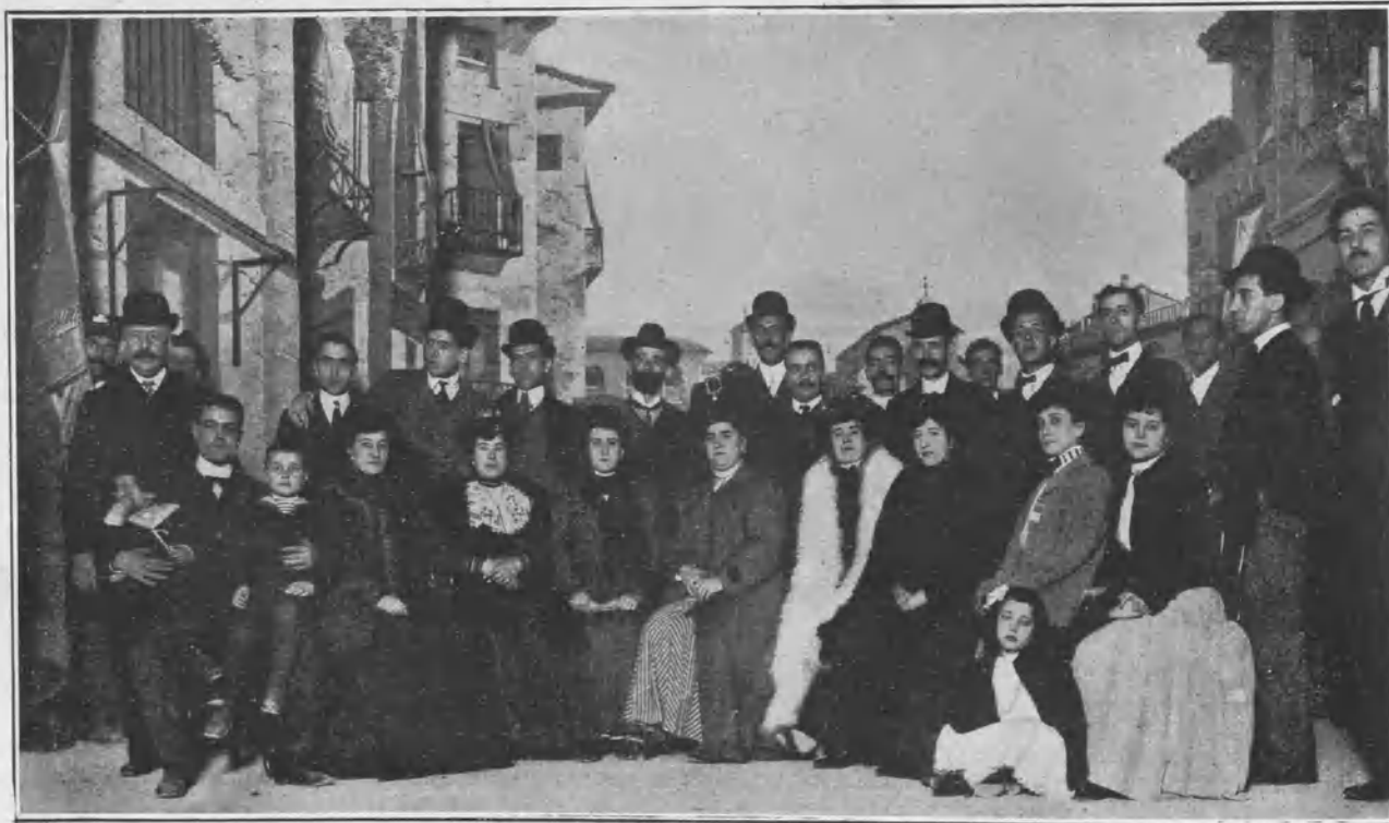
Principales figuras de la compañía y empresa de Lo Rat-Penat

Esto no quiere decir que el salón no sea elegante, pues elegante resulta la sencillez cuando la inspira el