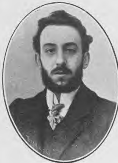
Hernán Cortés, autor del libro.

Un fabricante de guitarras llamado Mariano, que tiene una hija guapa, novia del aprendiz de la guitarrería, necesita de un préstamo de 1.500 pesetas para salvar del embargo su establecimiento. El tabernero Paco, amigo del citado industrial, está enamorado de la muchacha, y enterado del apuro en que se encuentra el padre de ésta, decide prestarle las 1.500 pesetas,