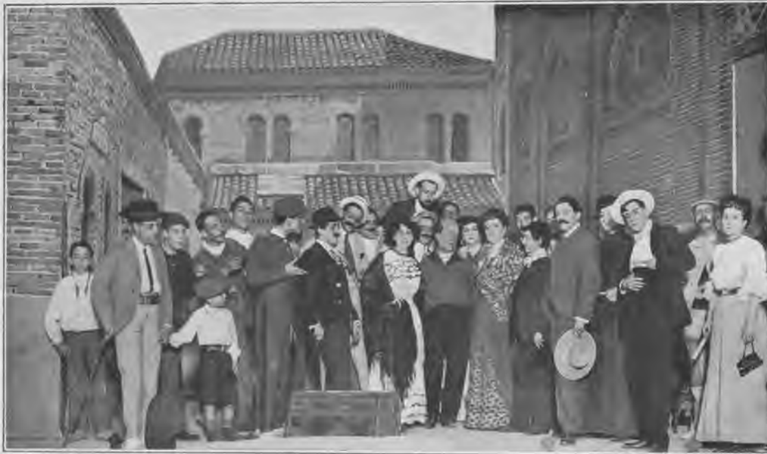
Escena final de la obra.

conoce, apreciándole sólo contusiones de poca importancia. Su mujer, que le ha reconocido desde el público, entra y se abraza á él, preguntándole por qué subía en globo y con semejante traje, á lo cual responde Mariano que fué por ganar la apuesta y no dejarlas en la ruina. Paco, al oír esto, protesta, diciendo que ha perdido por no cumplir lo firmado en el recibo, que era subir en el globo. Mariano le responde que ha subido, y Paco le replica que tres metros nada más, á lo cual Mariano contesta diciendo que no se estipuló la altura y que el globo le ha subido del suelo. Boni, que presencia esta disputa, se nombra juez en este pleito, y después de preguntar á todos los presentes si están seguros que Mariano ha subido (á lo cual todos