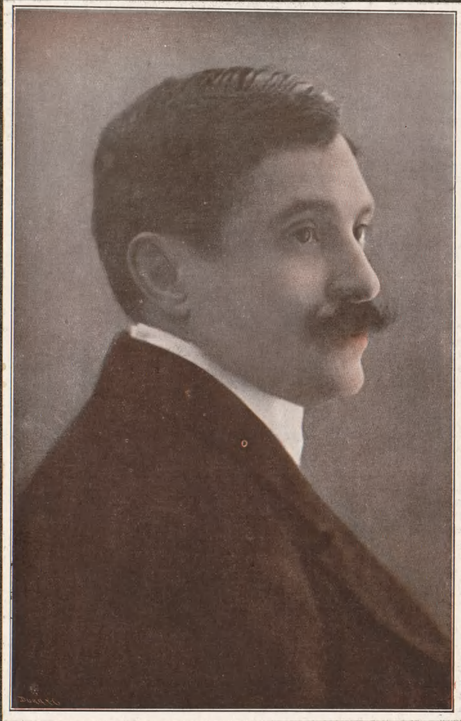
RAFAEL CALLEJA Popular composer