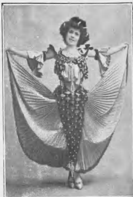
En „Loreto - Frégoli“