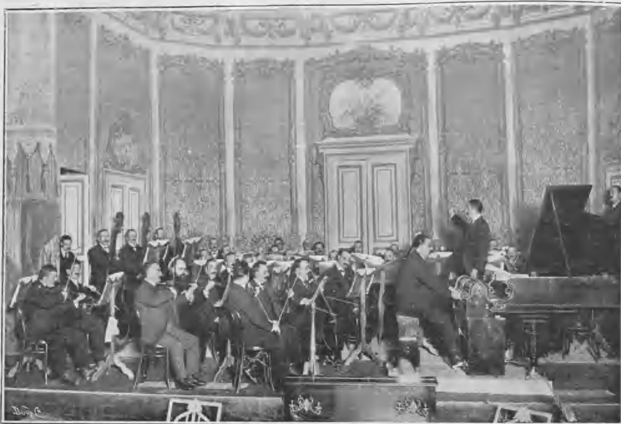
Aspecto del escenario del teatro de la Princesa durante el concierto verificado el día 5 del actual.