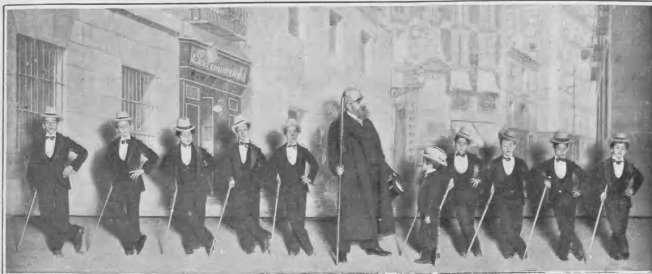
CUADRO II: Los del bastón.