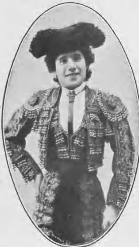
En „El jilguero chico“.

Una hermosa muerte — dijo el poeta — basta á embellecer toda una vida.