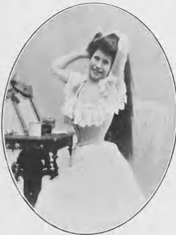
En „El tío de Alcalá“.