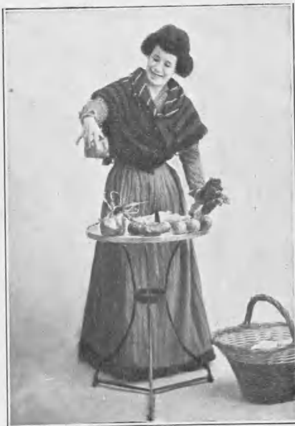
En „Congreso feminista“.

Merced a esa aguda capacidad perceptiva, que es para los buenos artistas como intuición instintiva o