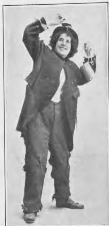
En „El juicio oral“.

siempre nos parece niña; la gracilidad mimbreada de su talle infantil, su movilidad incansable, su misma fealdad la defienden tenaz y triunfalmente de la vejez. Y esta fealdad, que ella reconoce alegremente, porque corrobora la virtualidad omnipotente del espíritu sobre la carne defectuosa, explica que sea la única actriz que tiene entre el elemento femenino verdaderas admiradoras. A las mujeres no las molesta que los hombres celebren a Loreto; ellas, enamoradas inocentes de la forma, presumen que aquellos aplausos sólo van dirigidos a la actriz. Pero muchas veces se equivocan; la gracia siempre corrige con éxito los errores de la línea.