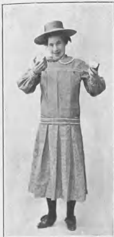
En „El chico de la portera“.