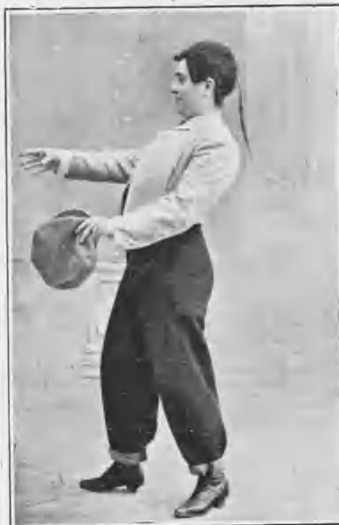
En „La estocá de la tarde“.

Realizan en ella estas dotes tan estimables la hermosura verdaderamente sugestiva y la modestia, que la hace doblemente simpática, acrecentando sus positivos méritos.