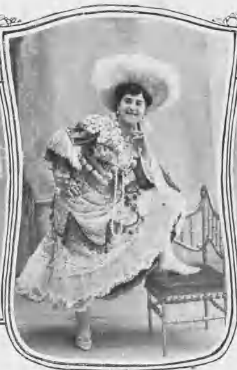
En „El arte de ser bonita“.