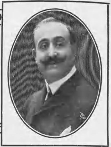
Emilio Thuillier, primer actor.

Deseario EL ARTE DEL TEATRO anticipar al lector algunas detalladas referencias de la temporada que el famoso comediante, al frente de su notable compañía, hará este invierno en la corte, fuese el cronista, con el fotógrafo indispensable, á la elegante morada que en la calle de las Fuentes habita el distinguido actor.