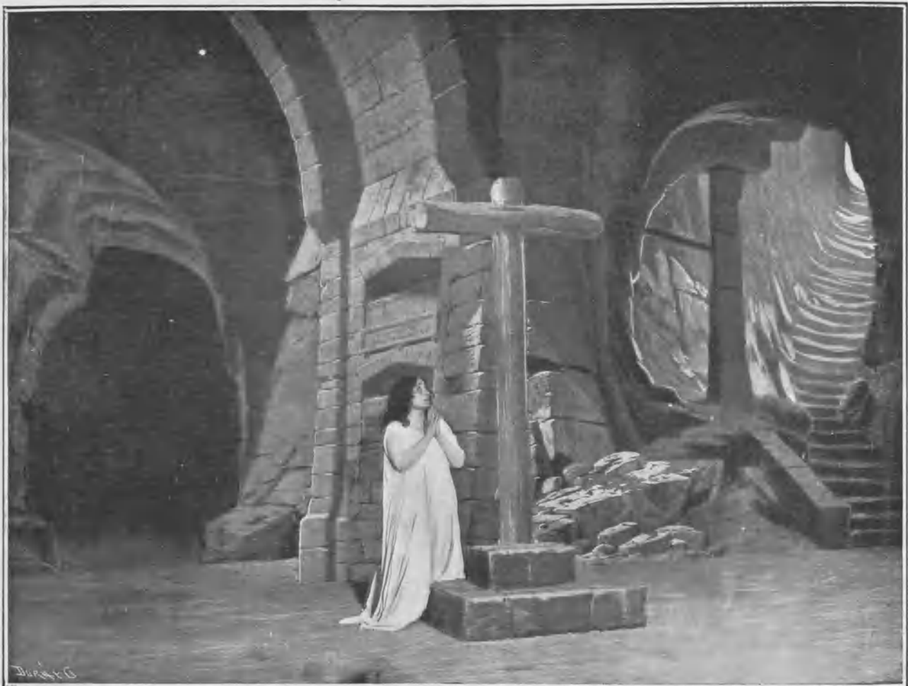
Cuadro IV. - Final de la obra.

Conste que no podemos referirnos á esta obra ni á ninguna de las que ha estrenado la compañía Guerrero-Mendoza. Por si el nombre de los autores que las refunden no fuera bastante garantía de discreción y competen-