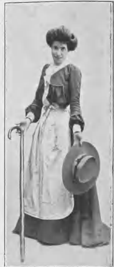
En „El tío de Alcalá“.