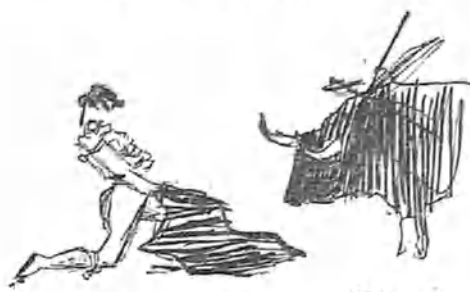
Después de la cogida