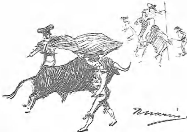
Machaquito y Lagartijo toreando á la limón al último toro.