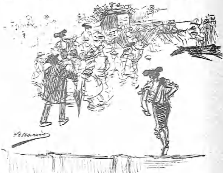
(El delirio final)