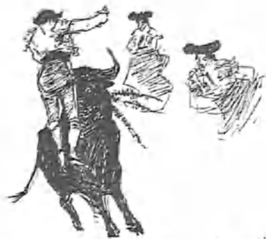
Cogida de Machaquito.