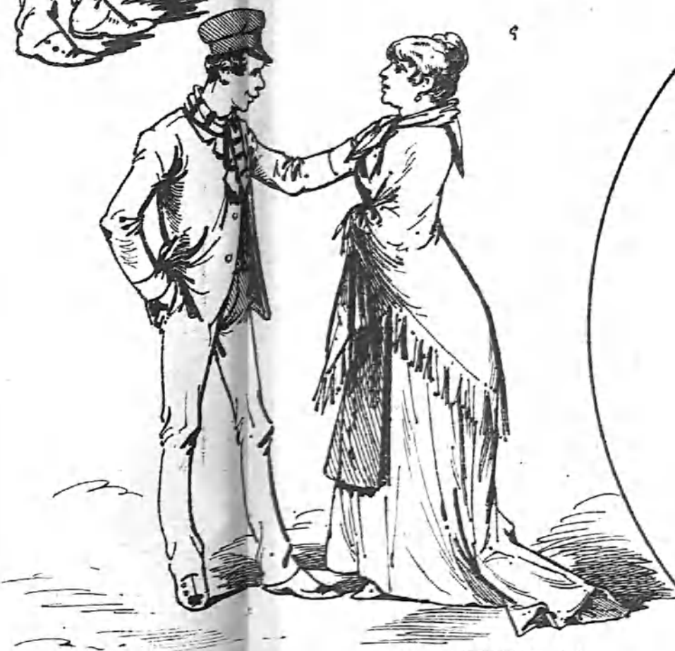
4.—Preparativos de nacimiento.