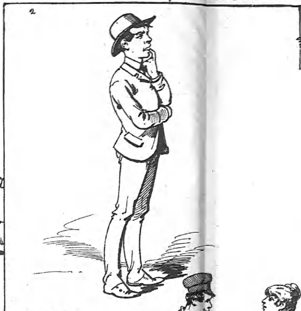
2.—Ahora con el dinero que me mande mi padre, desempeño la capa, compro un décimo, me cae el gordo, me caso con Julia y... ¿qué hago luego, vamos á ver? ¡De todos modos se aburre uno mucho!