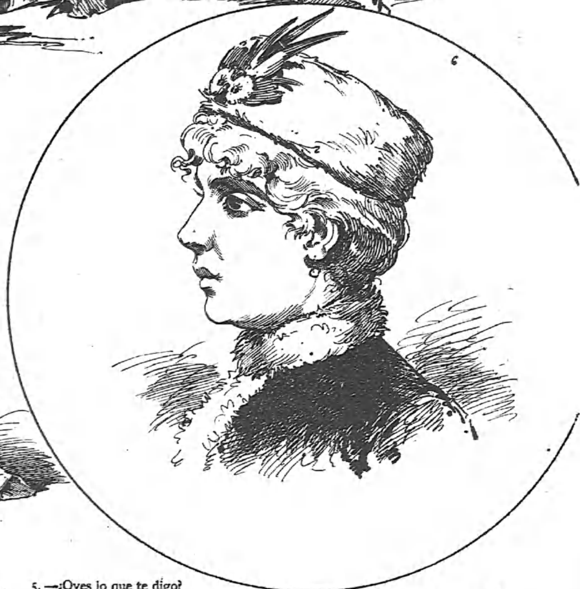
6.—Bónita proporción para hacer colación.