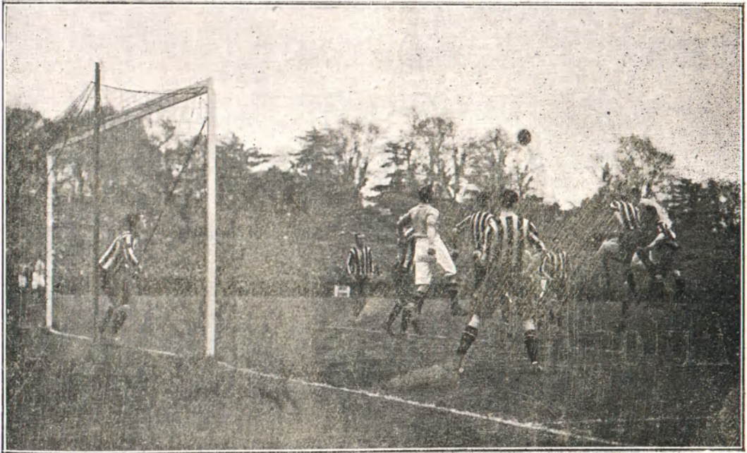
El football en Inglaterra. — Partido entre el «Everton» y el «Newcastle United».