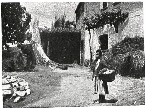
102.—SANTA COLOMA DE GRAMANET (CATALUÑA)