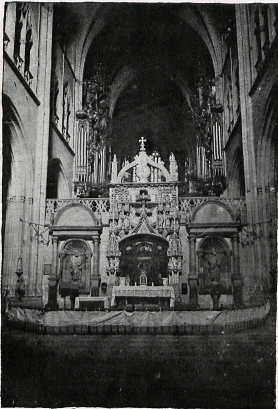
100.—CATEDRAL DE OVIEDO—ALTAR DE NUESTRA SEÑORA DE LA LUZ