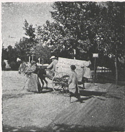
103.—PIANO PARA EL BAILE Inst. del Sr. Villegas.