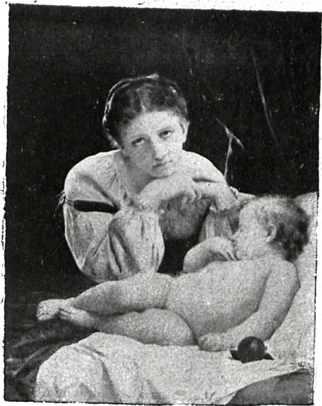
98 —EL ANGEL GUARDIAN— CUADRO DE W. BOUGUEREAU Inst. Coupil (París).

Una tragedia que... ¿Quieres oírla? Escucha.