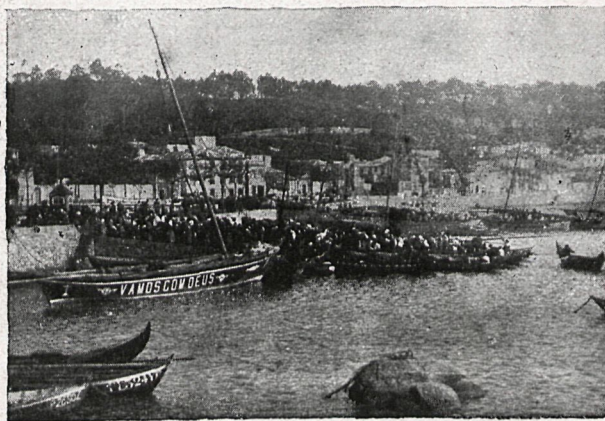
97.—LA LLEGADA DEL PESCADO.—CANTAREIRA-Foz de DAURO (PORTUGAL)

—¡En la nariz! ¿Qué puede ser eso? Y diga usted: ¿está fea? ¿Será esa la causa de la desaparición de Joaquinito?