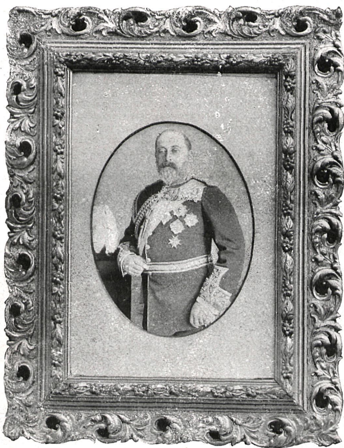
Núm. 96.—S. A. R. EL PRÍNCIPE DE GALES HEREDERO DEL TRONO DE LA GRAN BRETAÑA