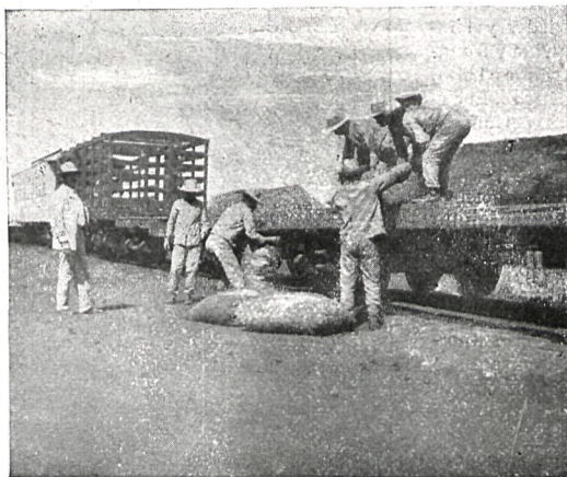
99.— DESCARGA DE RACIONES EN LA TROCHA DE JÚCARO (CUBA)